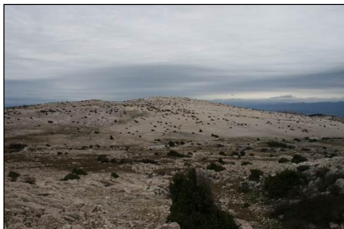
Slika 16: Najviši vrh otoka Krka Obzova (568m.n.m.)-VIII/17 Punat