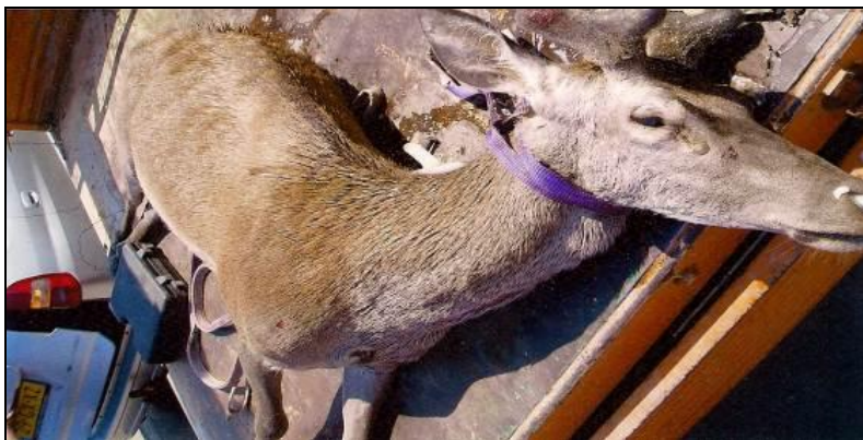
Slika 2: Izvađeni utopljeni jelen na plaži Baška 2008. g.