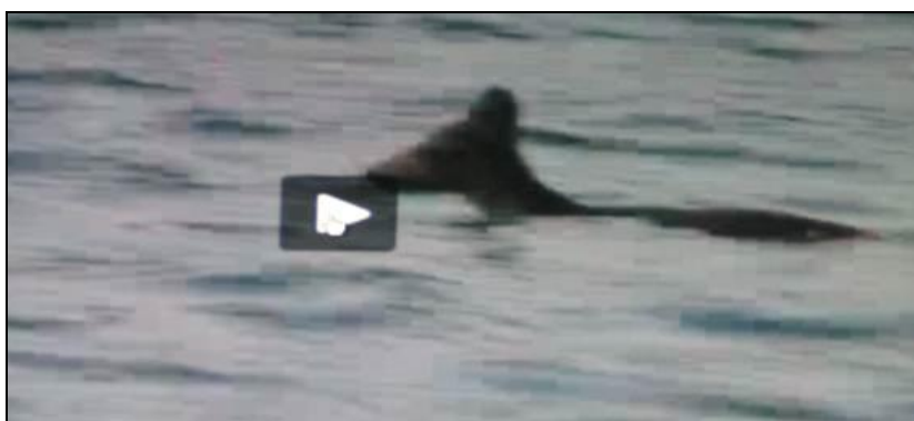
Slika 4: Srna u moru pliva s kopna na otok Krk