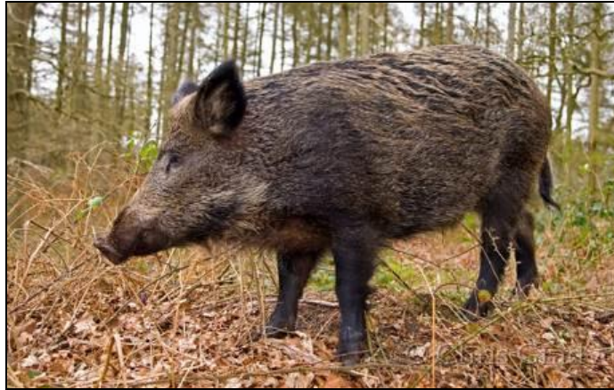
Slika 5: Divlja svinja