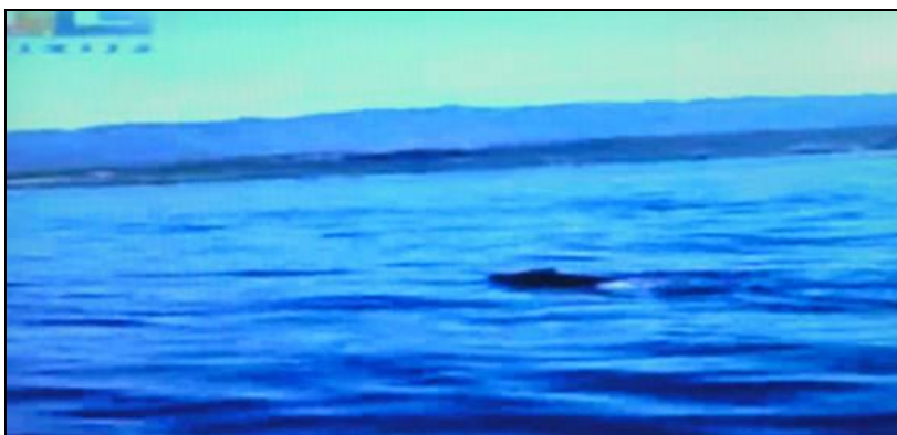
Slika 3: Divlja svinja pliva u moru s otoka Cresa na Krk