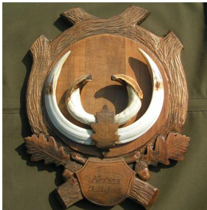
Slika 20: Najjače kljove veprova s otoka Krka; odstreljen u lovištu VIII/101 Krk 15. prosinca 2007. lovac Miljenko Drpić, ocijenjen sa 137,55 točaka

Kod divlje svinje trofej predstavljaju zubi očnjaci kod muških grla starijih od dvije godine. Ovaj trofej nazivamo kljovama, a djelimo ih na brusače i sjekače. Brusači su zubi očnjaci iz gornje vilice, a sjekači su zubi očnjaci iz donje vilice (VRATARIĆ, 2004.). U daljnjoj analizi trofeje nećemo djeliti po lovištima nego ćemo ih promatrati i uspoređivati kao trofeje stečene na otoku Krku.