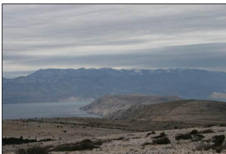
Slika 15: Pogled na otok Krk jugoistočni dio - lovište VIII/1 Baška