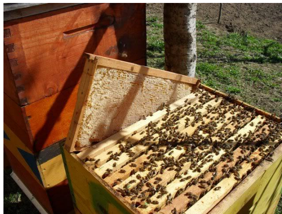
Slika 7. Košnica s pčelinjom zajednicom