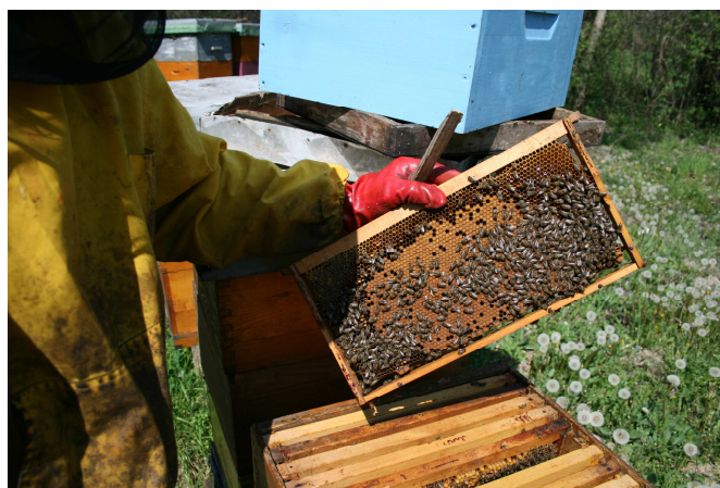
Slika 16 : Pojačavanje leglom

Pojačavanje pčelinjih zajednica pred glavnu pašu provodi se s ciljem maksimalnog iskorištavanja nadolazeće paše, tj. postizanja što većeg prinosa meda po košnici, a što postižemo povećanjem broja pčela u zajednici. Samo pojačavanje radimo dodavanjem okvira s poklopljenim leglom, prema vlastitoj procjeni (Slika 16). Okvire s leglom dodajemo najmanje petnaest dana prije početka glavne paše iz razloga da se dodano leglo izlegne i oslobodi prostor za smještaj nektara. Kod AŽ košnica pojačavanje vršimo leglom iz pomoćnih zajednica (Slika 17), dok kod LR košnica pojačavanje vršimo spajanjem nedovoljno jakih zajednica koje nisu u stanju donijeti značajne količine meda.