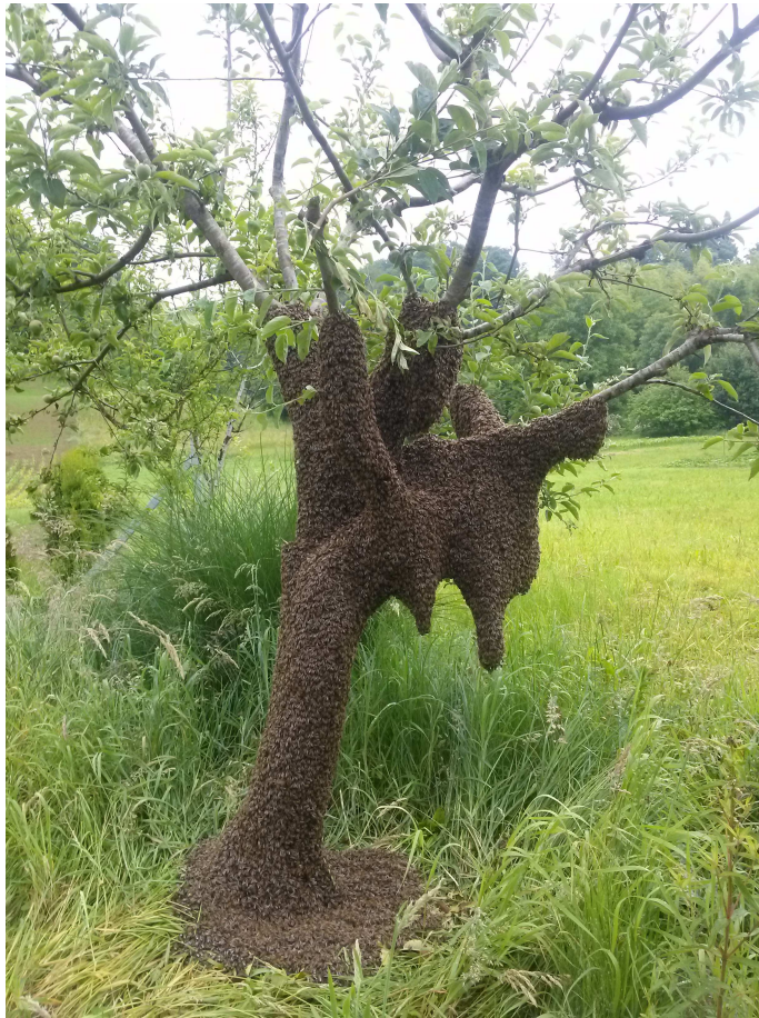
Slika 1. Zajednica pčela u prirodi

Pčele žive u velikim zajednicama od po nekoliko tisuća jedinki (Slika 1) . Pčela ne može živjeti sama za sebe i odijeljena od svoje zajednice brzo ugiba. Pčelinja zajednica sastoji se od ženskih i muških članova, ženski članovi su matica i radilice, a muški su trutovi. Matica je spolno razvijena ženka , a u svakoj zajednici nalazi se samo po jedna i živi u prosjeku 3 do 4 godine (Belčić i sur., 1990).