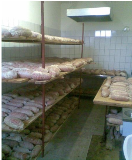
Slika 2. Prerada O.P.G. Mađarević

Obiteljsko gospodarstvo je započeo s prvim fazama testiranja tržišta kod prerade i prodaje suhomesnatih proizvoda, s ograničenim kapacitetima. Na Slici 2 se može vidjeti dio prerađevina i priprema svježeg mesa za suhomesnate proizvode.