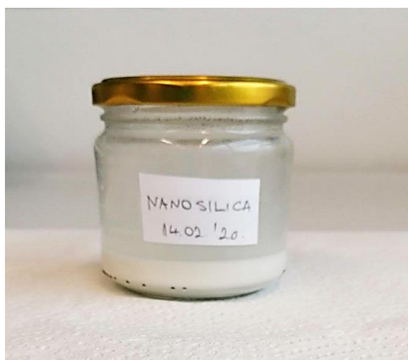
Slika 10. Pripremljena formulacija NanoS

Pripremljena formulacija NanoS čuvana je u staklenki obojanog stakla i držana u tami na sobnoj temperaturi do trenutka primjene.