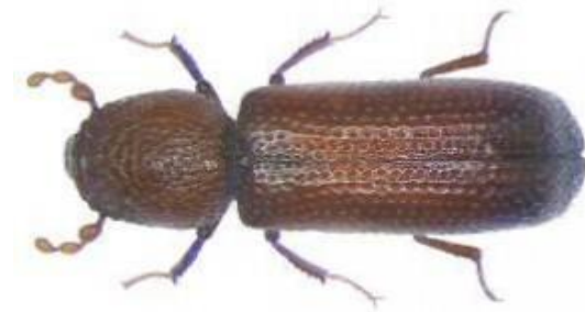
Slika 3. Žitni kukuljičar ( Rhyzopertha dominica Fab.)

Tijelo mu je dugo 2,3-3 mm, tamnosmeđe je boje (slika 3). Vratni štiti potpuno prekriva glavu okrenutu prema dolje. Pokrilje je hrapavo i točkasto udubljeno. Ticala su karakteristične građe; 3 zadnja segmenta tvore kijaču. Ženka odloži 100-500 jaja na razne proizvode. Ličinke oštećuju različite proizvode, a mogu se ubušiti u zrnje žitarica u kojem izgrizaju endosperm. Ličinke žućkaste, povijene, živi unutar zrna.