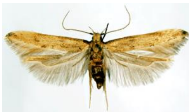
Slika 4. Žitni moljac ( Sitotroga cerealella Oliv.)

Jedna od najčešćih vrsta štetnih leptira u skladištima poljoprivrednih proizvoda (slika 4.). Ima raspon krila 15-18 mm. Odlaze jaja na zrnje žitarica ili u njegovoj blizini, gusjenice se ubušuju u zrno, te se hrane njegovim sadržajem.