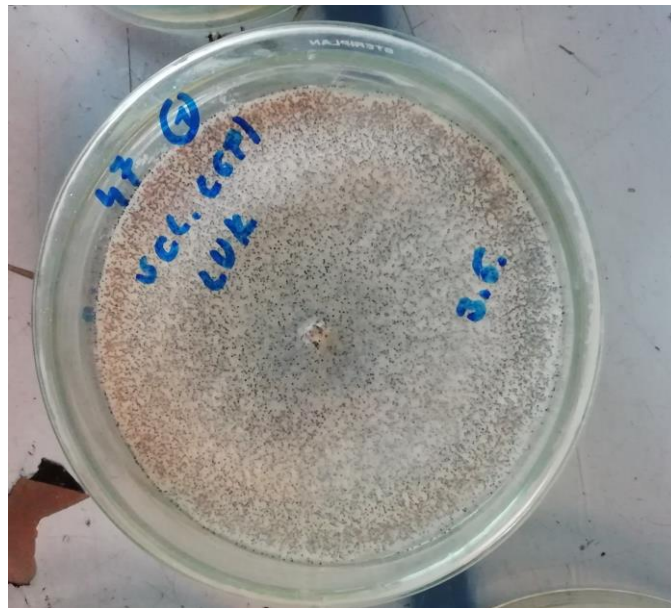
Slika 6. Čista kultura gljive Sclerotinia cepivorum (izvor: Brajković, 2019.)

Eterično ulje mirte nije imalo negativan učinak na rast micelija gljivice Macrophomina phaseolina pri temperaturi 22 °C i količinama 5 i 15 \mu l dok statistički vrlo značajno inhibira rast micelija gljive u odnosu na kontrolu primjenom u količini 25 \mu l. Ulje mirte je sedmi dan od nacjepljivanja imalo statistički vrlo značajan inhibicijski utjecaj na rast micelija gljive Sclerotium cepivorum kada je prijenjeno u količinama 5 i 25 \mu l u odnosu na kontrolu, a primjenom ulja u količini 5 \mu l micelij gljive je potpuno prerastao Petrijevu zdjelicu.