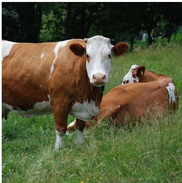
Slika 4. Simentalsko govedo

Tjelesna masa krava je od 600 do 750 kg, a visina grebena 135 do 140 cm. Boja dlake je svjetlo žuta do crvena s bijelim mrljama, te bijele glave i repa. Prosječna proizvodnja mlijeka je 5 028 kg mlijeka sa 4,05% mliječne masti i 3,32% proteina. Tovne sposobnosti simentalaca su visoke, tako dnevni prirast u tovu mlade junadi do 450 kg iznosi 1,2 do 1,3 kg, randman mesa je između 60 i 62%, kasniji je početak zamašćivanja trupova, vrlo dobra kakvoća mesa i mramoriranost (Agroklub).