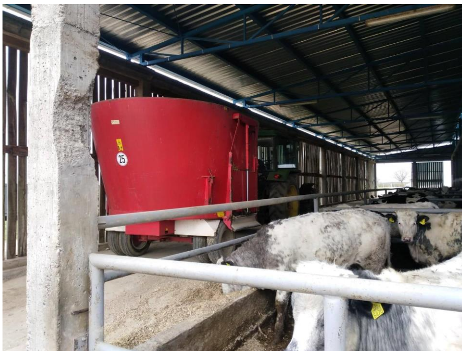
Slika 17. Mikser prikolica za pripremu i raspodjelu obroka u staji

Zadnjih godina sve značajnije mjesto u hranidbi zauzimaju „mikser prikolice“ u kojima se krmiva doziraju (važu), usitnjavaju i miješaju u „kompletno izmiješani obrok“. U ovako pripremljenom obroku krmiva su potpuno izmiješana te goveda ne mogu probirati krmiva, čime se popravlja učinkovitost hranidbe te umanjuje učestalost hranidbom uvjetovanih metaboličkih poremećaja.