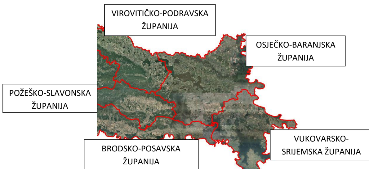
Slika 1. Područja u Republici Hrvatskoj na kojima se uzgaja šećerna repa ( http://preglednik.arkod.hr/ARKOD-Web/#layers=OSNOVNI%20PROSTORNI%20PODACI )

Šećerna repa u Republici Hrvatskoj uzgaja se na području Slavonije, Baranje, Srijema, Podravine i Međimurija (Slika 1.). Navedena područja pogodna su za uzgoj šećerne repe u Republici Hrvatskoj jer imaju tla pogodna za uzgoj iste. Na nekima je potrebno navodnjavanje, a neka su kisela pa se mora aplicirati karbokalk..