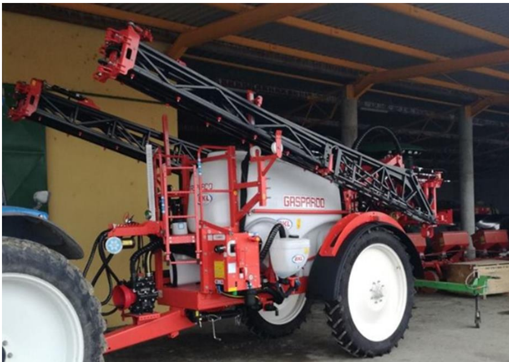
Slika 4. Prskalica Gaspardo OPG-a „Leko Tomislav“ kojom su obavljene sve kemijske mjere zaštite.

Svi fungicidi, kao i herbicidi, aplicirani su prskalicom marke Gaspardo (Slika 4.).