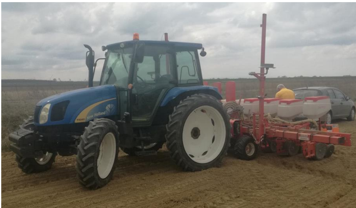
Slika 2. Traktor New Holland T5060 i sijačica Gaspardo Magica OPG-a „Leko Tomislav“