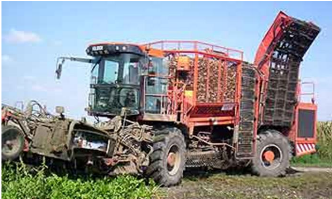
Slika 5. Vadilica šećerne repe