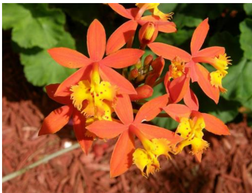
Slika 28. Vrsta roda Epidendrum

Samo ime Epidendrum (Slika 28.) govori da rastu na drveću. Broj i boja cvjetova ovisi o vrsti, a mogu biti orhideje sa pojedinačnim cvjetovima i orhideje sa mirisnim cvatovima. Rasprostranjene su od Južne Karoline do Argentine. Broje oko 750 vrsta.