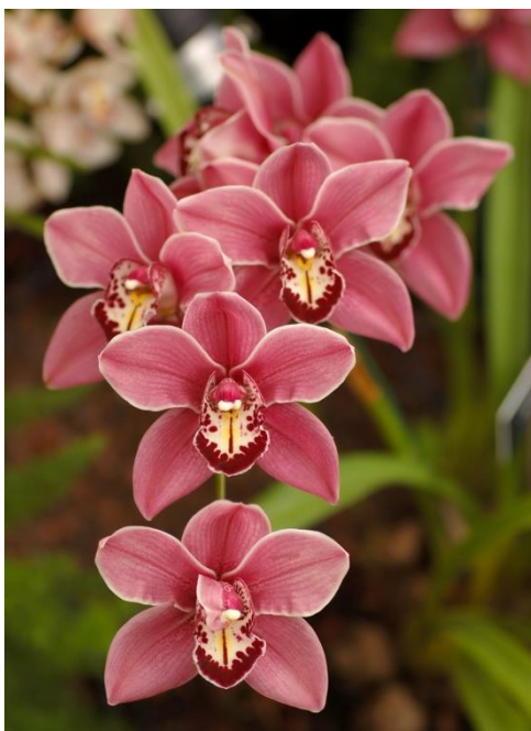
Slika 26. Vrsta roda Cymbidium

Listovi su dugi i zeleni, a stabljika je visoka 60 do 80 centimetara. Cvjetovi su veliki zbog čega se najviše cijene i često koriste kao rezano cvijeće. Zanimljivo je za vrste ovog roda da mogu preživjeti niske temperature, te cvjetaju zimi kada veći dio orhideja ne cvjeta. Rod Cymbidium (Slika 26.) broji oko 52 vrste. Rastu u tropskoj i subtropskoj aziji (Borneo, Filipini, Sjeverna Indija, Kina, Japan), ali i u sjevernoj Australiji gdje rastu na većim visinama i u hladnijim uvjetima.