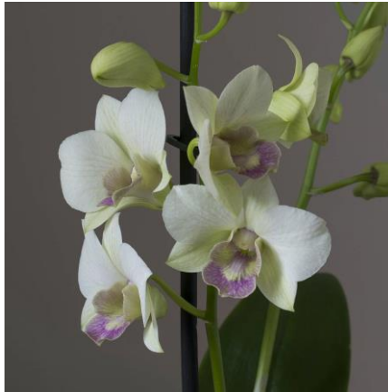
Slika 27. Vrsta roda Dendrobium

uzimaju dugu pauzu, a tijekom ljeta rastu. Staništa su im u istočnoj i jugoistočnoj Aziji, sjevernoj Australiji i Novom Zelandu. Rod Dendrobium (Slika 27.) broji oko 1200 vrsta.