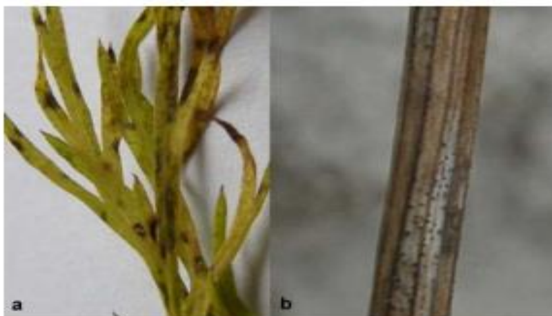
Slika 6. Simptomi pjegavosti: a – točke na listovima, b – piknidi na stabljici

Od bolesti se mogu pojaviti pepelnica ( Erysiphe umbelliferum ) i peronospora ( Plasmopara nivea ), koje su jedine bolesti koje mogu nanijeti znatnije štete usjevu. Njihova pojava može se spriječiti primjenom propikonazola u propisanoj koncentraciji (Šilješ i sur., 1992.). Najčešće bolesti na kimu uzrokuju gljive iz rodova Fusarium , Verticillium , Sclerotinia , Phomopsis i Ramularia . U Europi se pojavila epidemija septorioze koju uzrokuje Septoria carvi (Slika 5. i 6.). Njenom rasprostranjivanju pomaže vruće i vlažno vrijeme. Na temperaturama do 28 °C i niskoj relativnoj vlažnosti zraka pojavljuje se pepelnica koju uzrokuje Erysiphe heraclei (Zalewska i sur., 2015.) (Slika 7.).