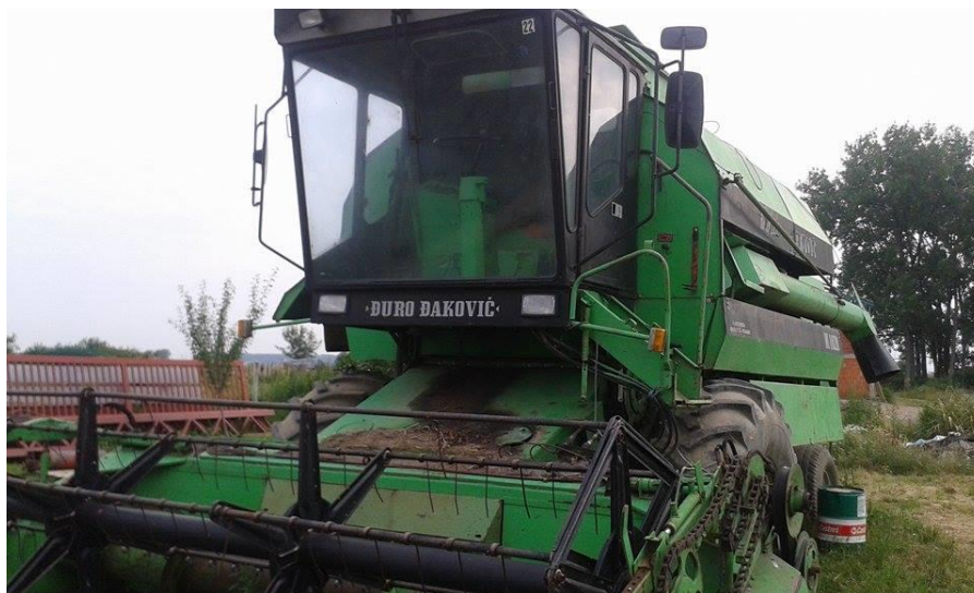
Slika 9. Kombajn Đuro Đaković M1620