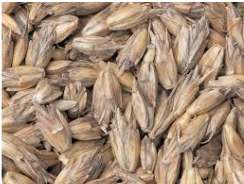
Slika 3. Zrno pira

Plod je krupno, ovalno zrno (Slika 3.). Masa 1000 zrna iznosi 40-45 g. Hektolitarska masa neoljuštenoga pira je 40-45 kg, no oljuštenog i preko 80 kg. Zrno se sastoji od omotača, klice i endosperma.