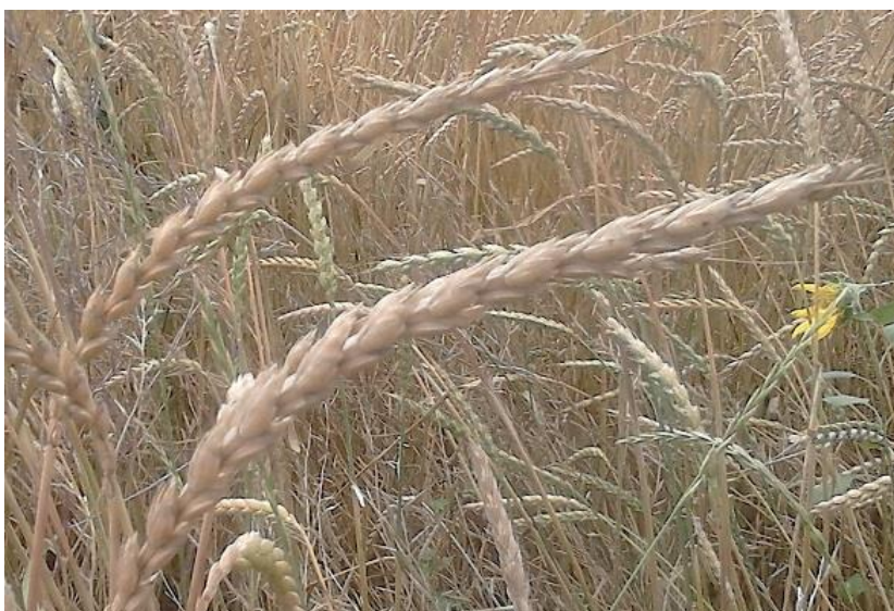
Slika 10. Klas pira u zriobi

predvidjeti kvalitetu uroda. Što je sjajnije pljevica, to je urod kvalitetniji. Treba paziti da se vlaga ne snizi ispod 12%, jer tada pljevice počnu tamniti. Na slici 10. prikazan je klas pira u zriobi. Pir u agroekološkim uvjetima Europe sazrijeva sredinom srpnja. Na površinama obrta „Klica“ žetva je započela 17. srpnja, a završila je pet dana kasnije.