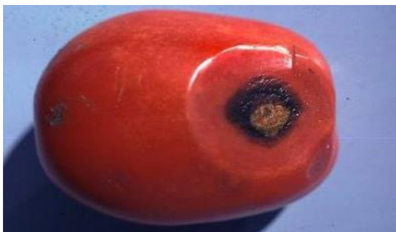
Slika 8: Antraknoza ploda rajčice

Antraknoza, uzrokovana gljivicom Colletotrichum coccodes , je jedno od najčešćih oboljenja rajčice. Prvi simptomi postaju vidljivi na zrelom plodu ili tijekom zrenja kao male kružne mrlje na koži. Kako se ove mrlje počinju širiti, razvija se tamno središte ili koncentrični prstenovi s tamnim pjegama, koje stvaraju spore od gljiva (Slika 8.).