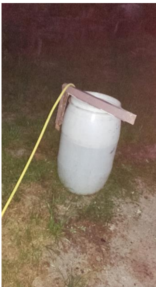
Slika 17: Izrada tekućeg gnojiva

Prvo tretiranje kompostnim čajem (glisnjakom) je obavljeno 26.05.2016. godine zalijevanjem tla ili nadzemnog dijela biljke ili oboje ovisno o varijanti pokusa. Tretiranje glisnjakom je obavljano još dva puta 15.06.2016. i 10.07.2016.