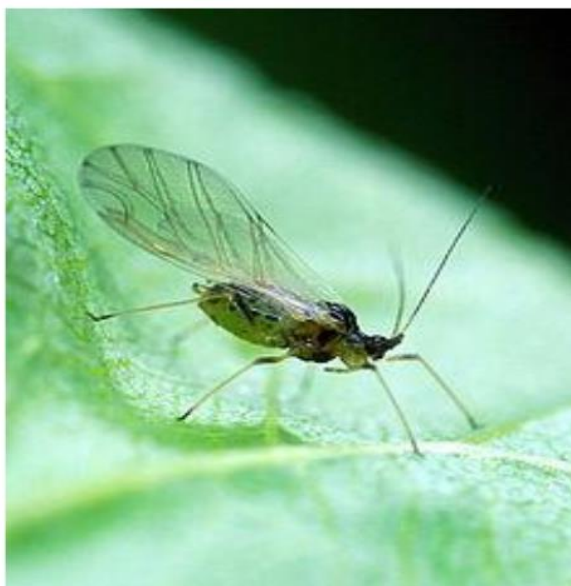
Slika 5. Lisna uš