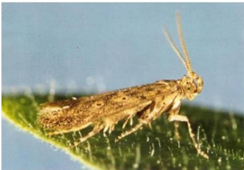
Slika 6. Lisni miner rajčice