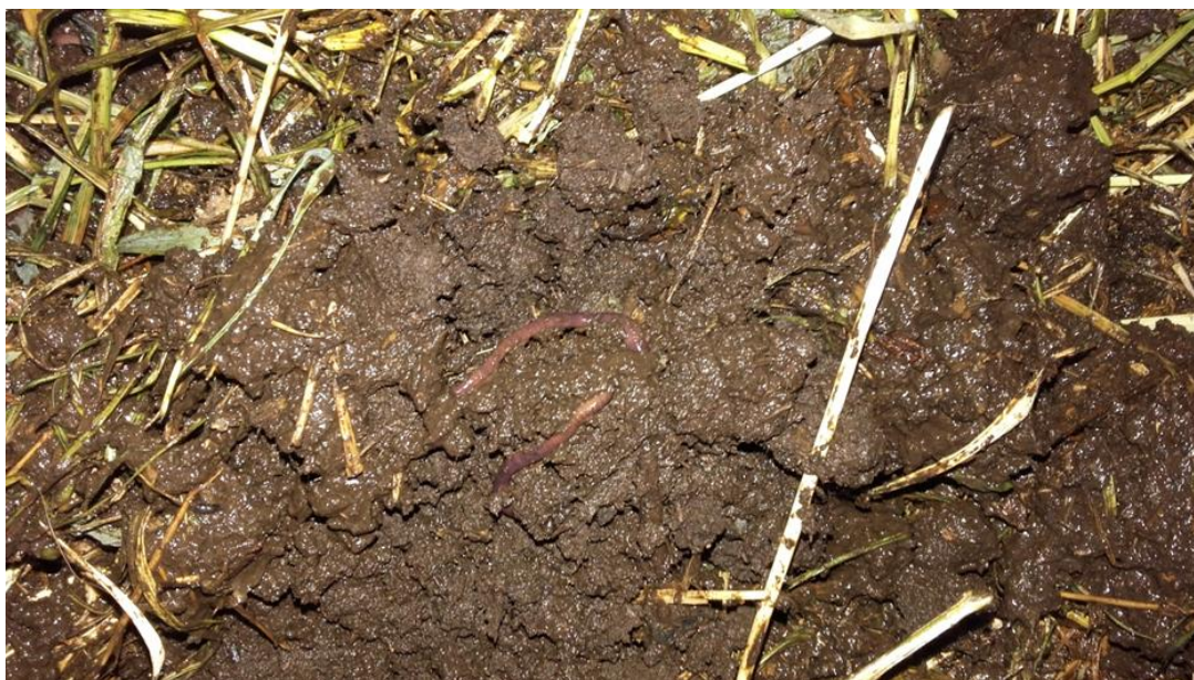
Slika 12: Kalifornijska glista

proizvodnju sadnica. U poljodjelstvu i povrtlarstvu služi kao osnovno i startno kao i za prihranjivanje tijekom vegetacije.