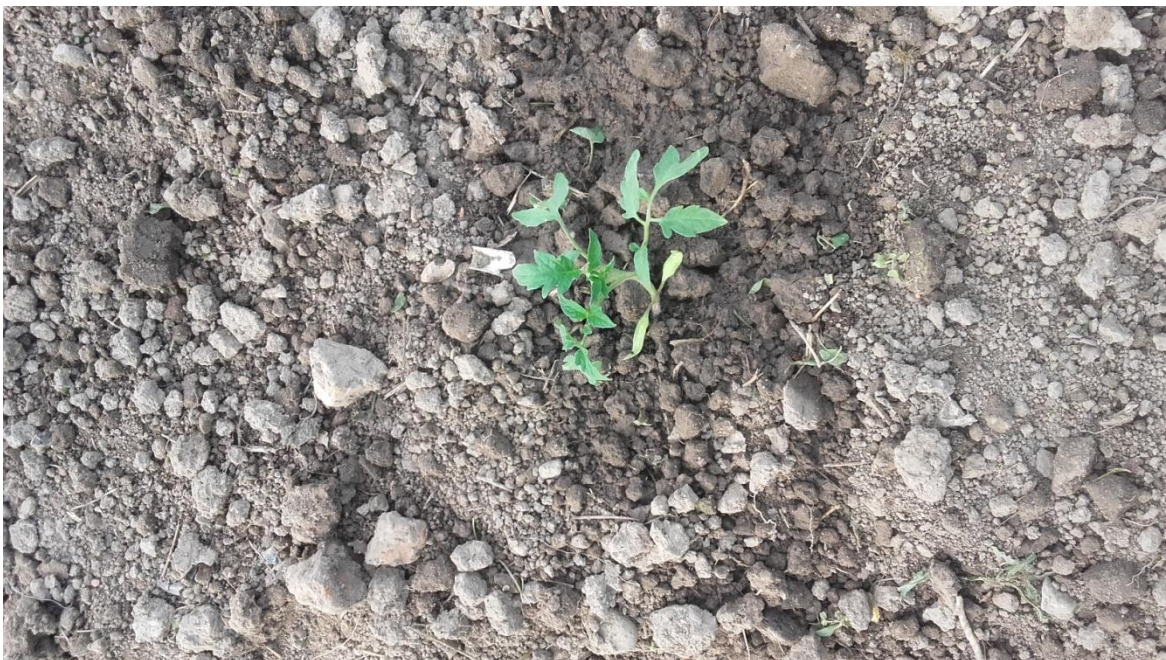
Slika 16: Biljka rajčice