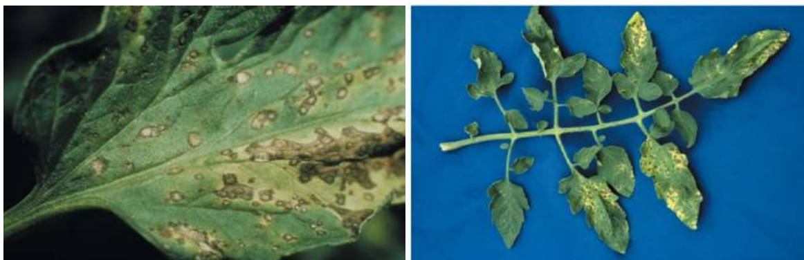
Slika 10: Septoria pjege na listu