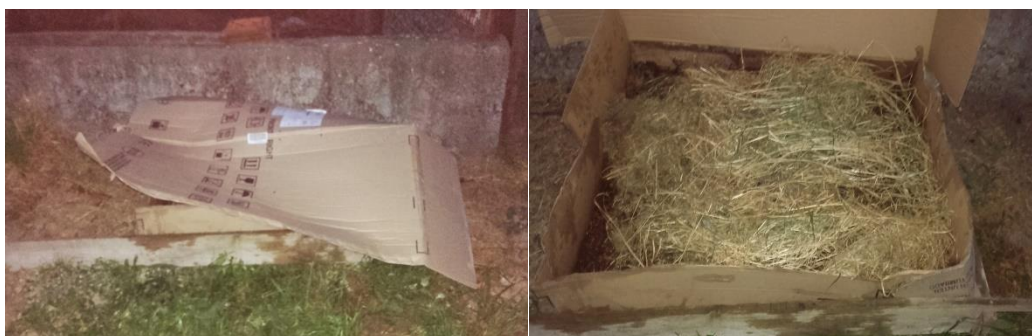
Slika 14: Završni sloj mjesta za glisnjak

Presadnice u sadene u razmaku od 50 cm. Smještene su u sredinu držeći se za stapku. Ogrnute su zemljom te su dobro učvršćene. Sadnja je obavljena 26. travnja 2016. godine. Razmak između redova je ostavljen dosta širok radi višekratne berbe i njege usjeva (Slike 15. i 16.). Svi agroekološki uvjeti – temperatura, svjetlost, voda i tlo su bili optimalni od sadnje pa do berbe. Vremenski uvjeti su bili povoljni za rast korova, tako da je već sredinom svibnja obavljeno prvo mehaničko odstranjivanje korova i plijevljenje nasada. Drugo odstranjivanje korova je obavljeno krajem svibnja kada se obavilo i zagrtanje do prvih donjih listova.