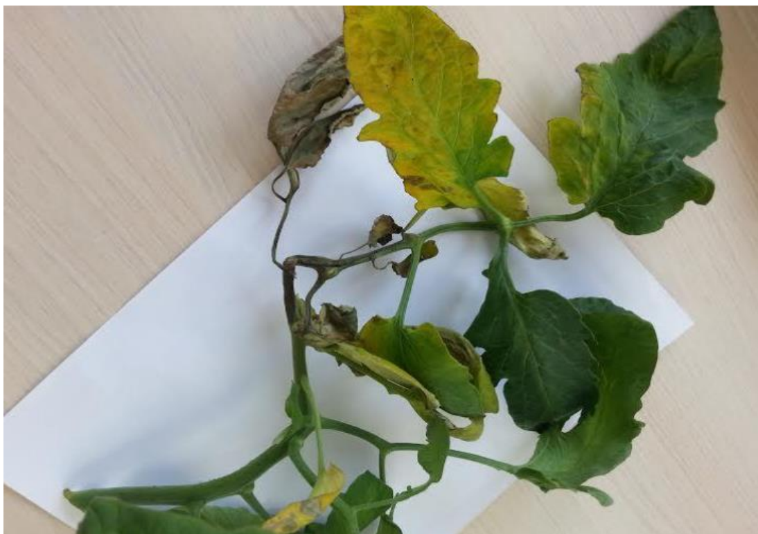
Slika 11: Simptomi fuzarioze na listu rajčice