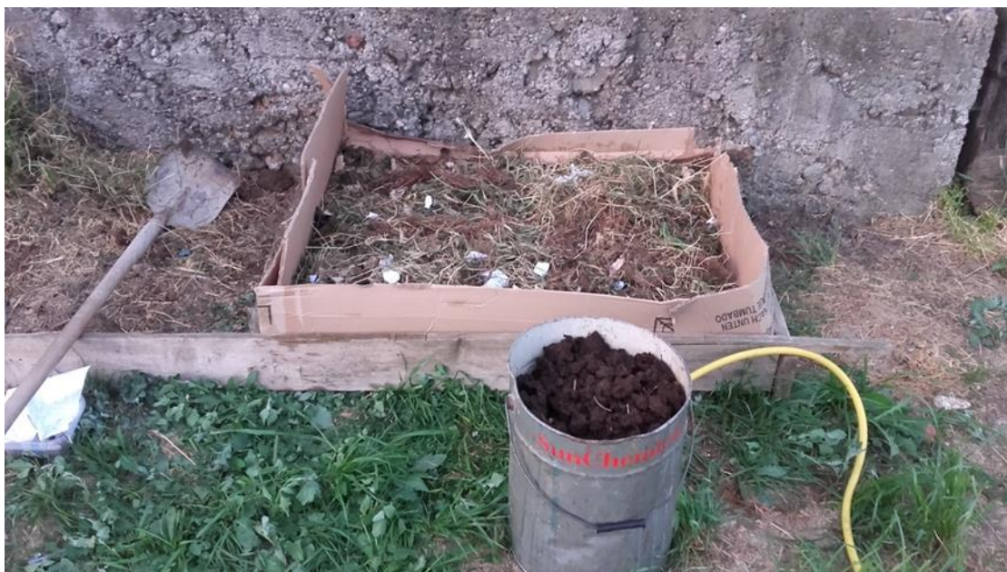
Slika 13: Izrada mjesta za glisnjak