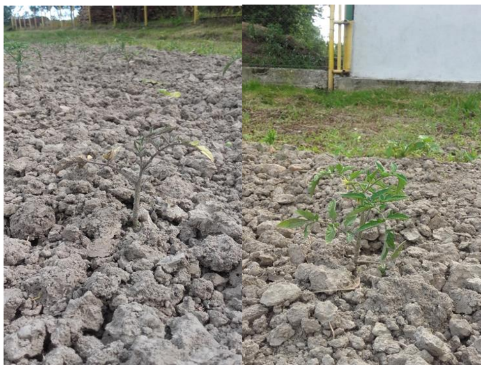
Slika 18: Primjer bolesne i zdrave rajčice

Iz navedenih rezultata se vidi da je pojava plamenjače bila slabijeg intenziteta, i ocjena bolesti nije bila veća od 1 (Slika 18.), dok se indeks bolesti kretao od 0,04 (Gz+Gp) do 0,08 u kontroli.