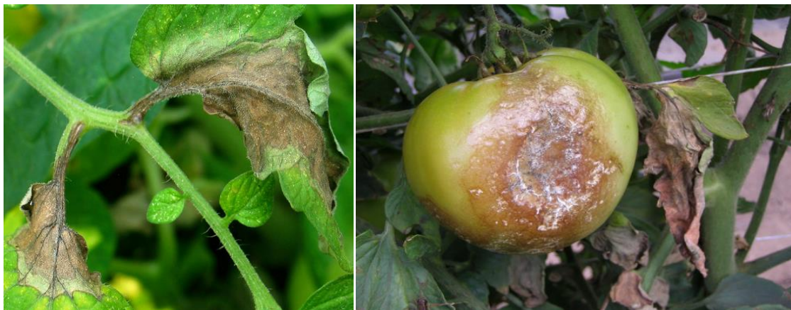
Slika 7: Kasna plamenjača – oštećeni listovi i plod rajčice