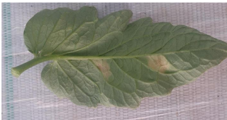
Slika 9: Baršunasta plijesan

Ova bolest javlja se u zaštićenim prostorima na osjetljivim sortama rajčice. Obično se javi u niskim plastenicima za vrijeme kišnog vremena, kada je teško regulirati vlagu, a temperatura u objektu bude 20 – 22 °C. Napad bolesti počinje od donjih najstarijih listova i širi se prema vrhu biljke. Na licu lista javljaju se nekroze, a s donje strane maslinastozelene baršunaste prevlake (Slika 9.). Ako gljiva napadne čitav list on se deformira i osuši. Zaraza se može proširiti na cvjetove koji otpadaju, a rjeđe zahvaća i plod. Uzročnik bolesti preživljava u tlu na zaraženim biljnim ostacima ili na armaturi plastenika. Izvor zaraze može biti zaraženo sjeme. Za razvoj gljive potrebna je temperatura 10-32 °C (optimalna 22 °C). Bolest se razvija samo pri visokoj relativnoj vlazi zraka (>85%) (Maceljki i sur. 2004).