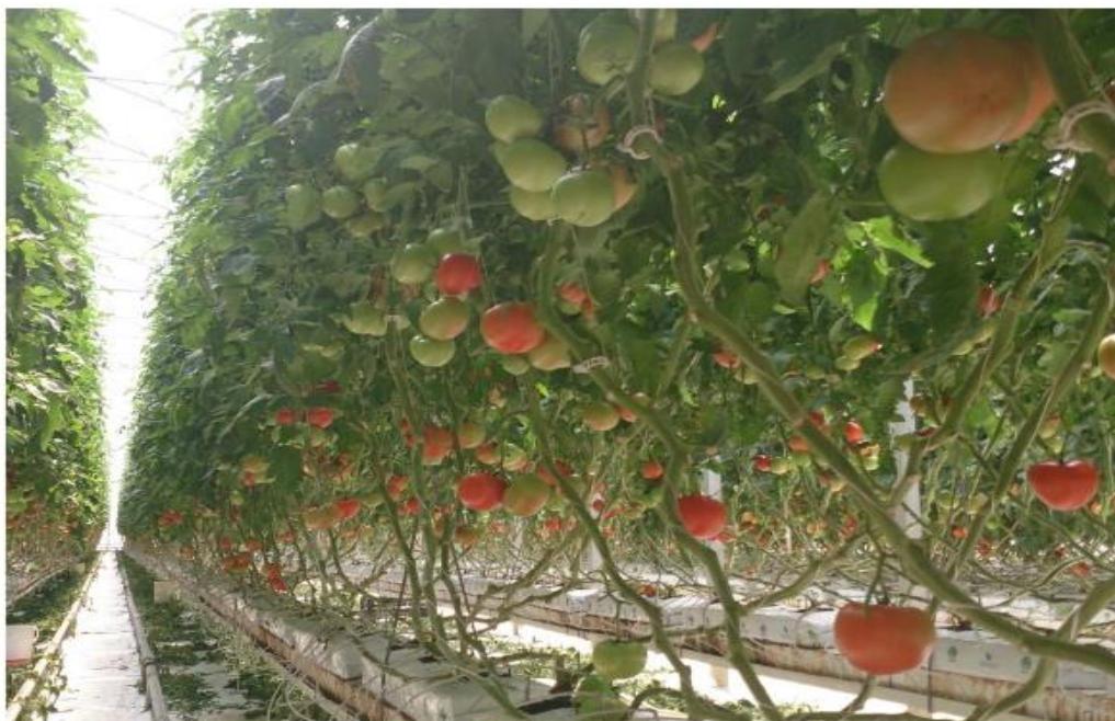
Slika 2. Hidroponski uzgoj rajčice

Dugogodišnja eksploatacije tla i nepoštivanje plodoreda u plastenicima dovodi do gubitka kvalitete tla, loše strukture, stvaranja nepropusnog sloja, visokog sadržaja hraniva i soli, pojava štetnika i bolesti tesmanjenja prinosa. Iskustva razvijenih zemalja govore da je najbolje rješenje uvođenje hidroponskog načina uzgoja povrća. Riječ hidropon dolazi od grč. Hydor - voda i ponos –rad, a predstavlja uzgoj biljaka na inertnim supstratima ili bez njih u hranjivoj otopini (Slika 2.)(Parađiković, 2008). Hidroponska tehnologija uzima zamah sredinom 20. stoljeća. Trenutačni lider u hidroponiji je Nizozemska koja je prije 15 godina imala čak 40% zaštićenih prostora s takvom proizvodnjom. Hrvatska je još uvijek na početku te su površine pod hidroponskom proizvodnjom zanemarive. Glavni oblik proizvodnje povrća u hidroponu jest uzgoj u inertnom supstratu.