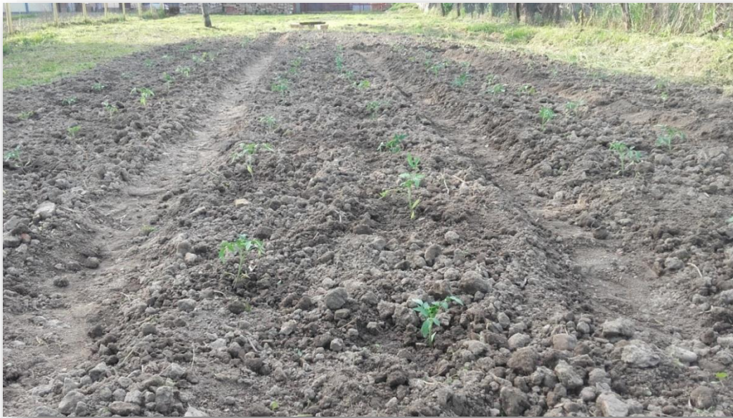
Slika 15: Sadnja rajčice