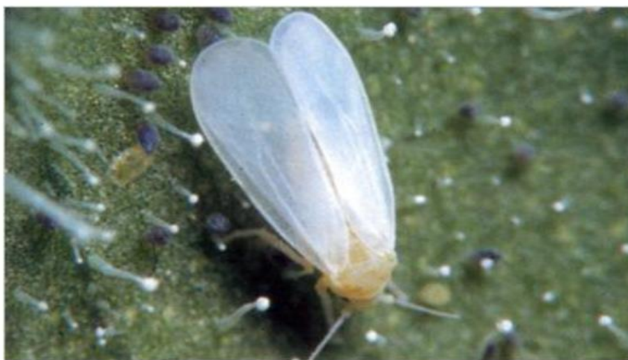
Slika 4. Napad cvjetnog štitastog moljca

Da je biljka zaražena tim štetnikom možemo vidjeti po mednoj rosi po plodovima i listovima, a kasnije se na ljepljivim naslagama razviju gljive čađavice. Odrasli oblici "leptirića" i jaja nalaze se masovno uvijek na vršnim listovima, a ličinke i kukuljice nalaze se na listovima donjih etaža. Početne zaraze odraslim oblicima teško se uočavaju jer se nalaze na naličju listova. Od plodovitog povrća najviše strada rajčica. Njezin prirod može biti smanjen do 40 % što je vrlo visok postotak (Maceljski, 2002).