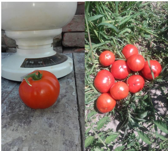
Slika 19: Plod rajčice

Kompostni čaj se općenito koristi na dva načina ili za kontrolu bolesti ili kao hranivo i promotor rasta. Iako je u našim istraživanjima pojava i intenzitet plamenjače bila slabijeg intenziteta uporaba kompostnog čaja je rezultirala većim urodom rajčice u usporedbi s kontrolom. Kompostni čaj pokriva površinski sloj biljke i korijen s mikroorganizmima osiguravajući povoljne uvjete za rast rajčice. Kombinacija kompostnog čaja i hraniva s pokazala kao jeftina, okolišno prihvatljiva i sigurna metoda u kontroli plamenjače rajčice u istraživanjima (Al-Mughrabi, 2007.). Također je utvrđeno da kompostni čaj aktivira induciranu otpornost kod biljaka. Naša istraživanja potvrđuju korisnost kompostnog čaja u uzgoju rajčice i kontroli plamenjače rajčice.