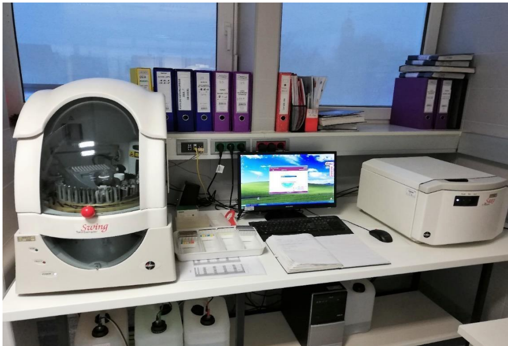
Slika 5. Twin sampler Swing