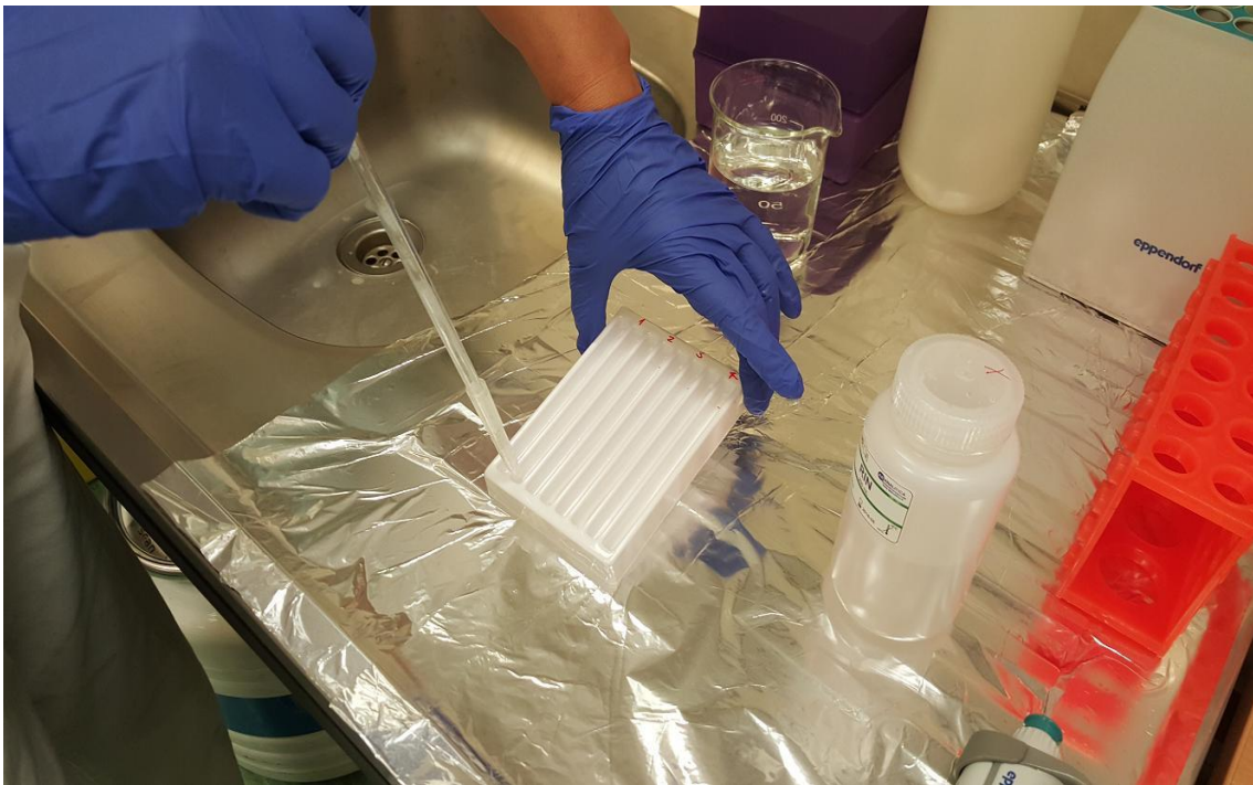
Slika 6. Vakumska aspiracija pufera dodanog u kadicu s genotip-trakicama