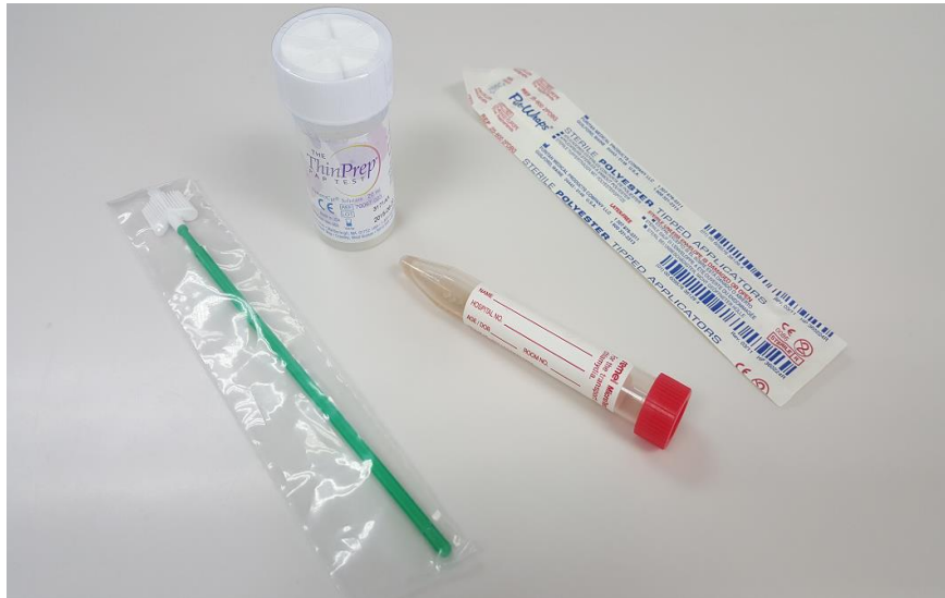
Slika 1. Medij za uzorkovanje HPV-a