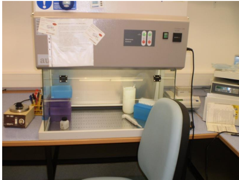
Slika 2. Biokabinet za sterilni rad laboratorij za molekularnu dijagnostiku mikroorganizama

8. Pripremljena mikrocentrifugalna tubica sadržavala je eluiranu, pročišćenu DNA koja se mogla odmah koristiti ili skladištiti na -20°C do daljnje upotrebe.