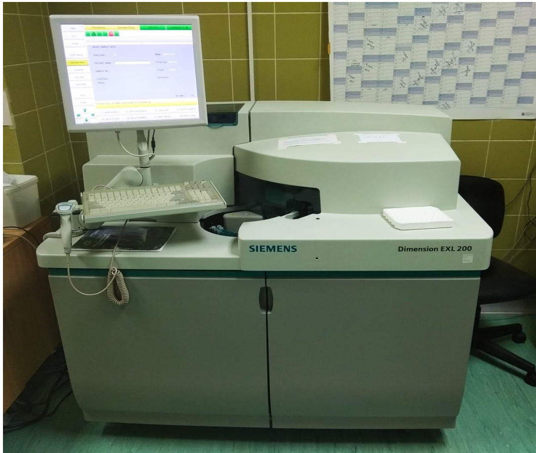
Slika 4. Dimension ExL uređaj, tvrtke Siemens

Princip metode određivanja albumina u urinu: Imunoturbidimetrijskom metodom određen je albumin u uzorku urina na instrumentu Beckman Coulter AU680 i uz reagens Tina-quant MAU, Roche Diagnostics . (Slika 3.) Imunoturbidimetrijska metoda temelji se na reakciji između albumina iz uzorka i antitijela albumina antihumanog seruma. Tako nastaju imuni kompleksi koji raspršuju svjetlost, a zatim se mjeri promjena apsorbancije na 380 nm, koja je proporcionalna koncentraciji albumina u uzorku.