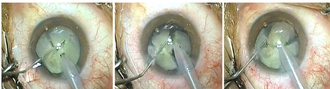
Slika 2. Usitnjavanje i aspiracija zamućene leće tijekom fakoemulzifikacije kroz rez od 2,75 mm (1).

Fakoemulzifikacija je metoda ekstrakapsularne ekstrakcije leće pomoću ultrazvuka koji u današnje vrijeme znači standard u operaciji katarakte. Izvodi se kroz rez na rožnici veličine svega 2-3 mm. Pomoću ultrazvučne sonde nukleus leće se usitnjava uz istovremenu aspiraciju usitnjenih komadića leće. Osnovni problem u početku razvoja ove metode operacije bilo je oštećenje endotela rožnice slobodnim radikalima i energijom ultrazvuka. Problem je riješen napretkom kirurške tehnike i tehnologije te razvojem viskoelastika, specijalnih viskoelastičnih gelova (1).