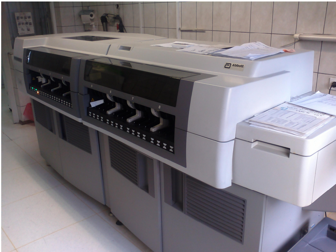
Slika 1. Analizator ARCHITECT 4100

Brzina rada analizatora je 800 testova na sat. Sustav za manipulaciju uzoraka sastoji se od etiri podjedinice sa po pet podjedinica za nosa e uzoraka. Jedan spremnik za reagense sadrffi 90 pozicija koje se koriste za R1 i R2 komponente reagensa, te moľe pohraniti reagense za 50-55 razli itih testova. Ovo istraflivanje je ra eno u biokemijskom laboratoriju Op e bolnice Slavonski Brod.