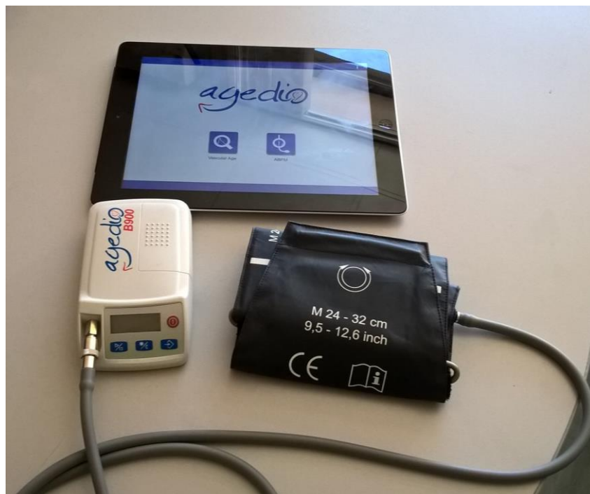
Slika 1. Uređaj „Agedio B900“

U istraživanju korišten je uređaj „Agedio B900“ (Slika 1.). Uređaj je dimenzija 130 x 75 x 30 mm, koristi oscilometrijsku tehnologiju i omogućuje istovremeno mjerenje perifernog krvnog tlaka i PWV. Detektira tlakove od 60 do 290 mmHg (sistolički) te od 30 do 195 mmHg (dijastolički) i puls od 30 do 240 u minuti. Uz pomoć tvornički ugrađenog softvera i algoritama izračunava centralni aortalni krvni tlak, minutni volumen srca, periferni otpor, AI, augmentacijski tlak i koeficijent refleksije te procjenjuje krutost arterija. Uređaj se može spojiti na računalo kako bi se prikazali izmjereni podatci. Na kraju svakog mjerenja uređaj napravi dva izvješća, jedno za liječnika, jedno za bolesnika. Mjerenja uređajem „Agedio B900“ učinjena su prije i nakon HD-a. Svakom bolesniku izmjerena je tjelesna masa prije i nakon HD-a. Nakon vaganja, a prije mjerenja, ležali su na krevetu deset minuta. Ispitanici su za vrijeme mjerenja bili u ležećem položaju, mirovali su i nisu smjeli pričati. Manšeta se stavljala na ruku suprotno od krvožilnog pristupa za HD. Mjerenje prije i nakon HD-a radilo se na istoj ruci.