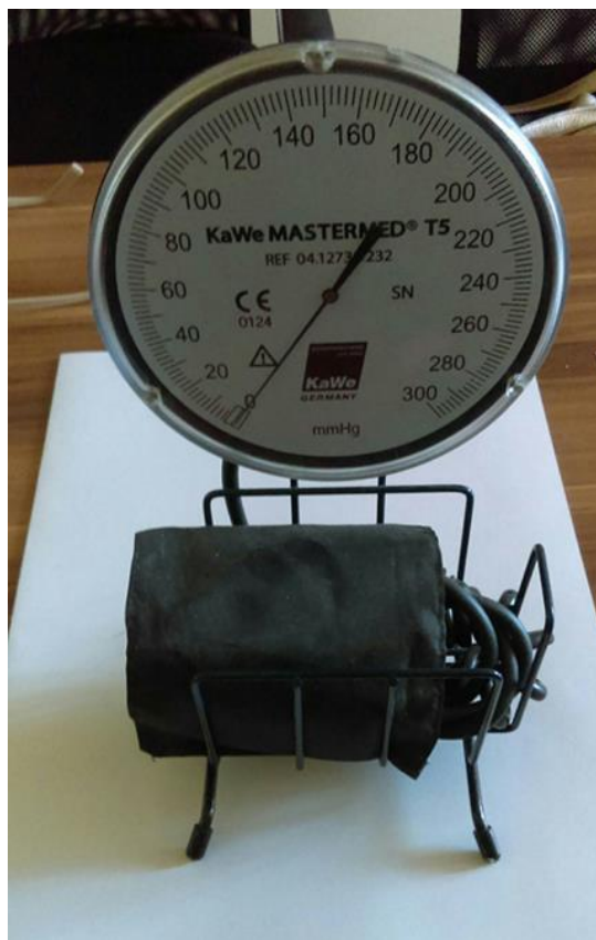
Slika 1. Oscilometrijski tlakomjer KaWe MASTERMED