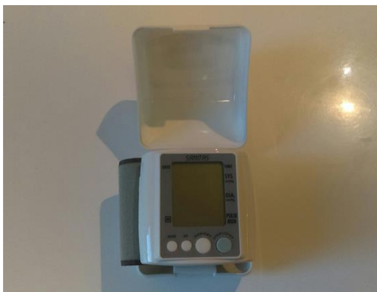
Slika 2. Digitalni tlakomjer za podlakticu Sanitas SBM 06