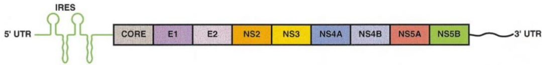
Slika 2. Organizacija genoma virusa hepatitisa C