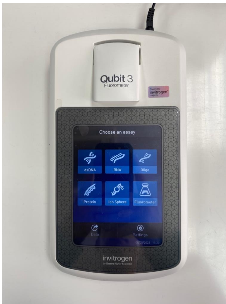
Slika 2. Qubit 3 Fluorometer (Thermo Fisher Scientific, Waltham, Massachusetts, SAD), uređaj za mjerenje koncentracije DNA, RNA i proteina u uzorcima.

Provjera koncentracije DNA provedena je prema protokolu proizvođača Thermo Fisher Scientific (31).