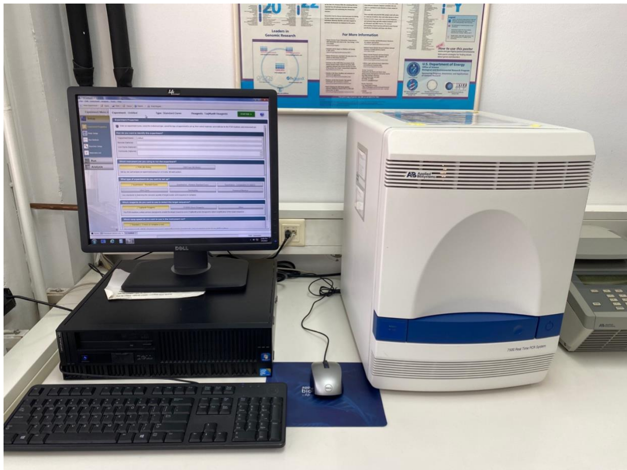
Slika 2. Uređaj Applied Biosystem 7500 Real Time PCR (Waltham, Massachusetts, SAD) proizvođača Thermo Fisher Scientific