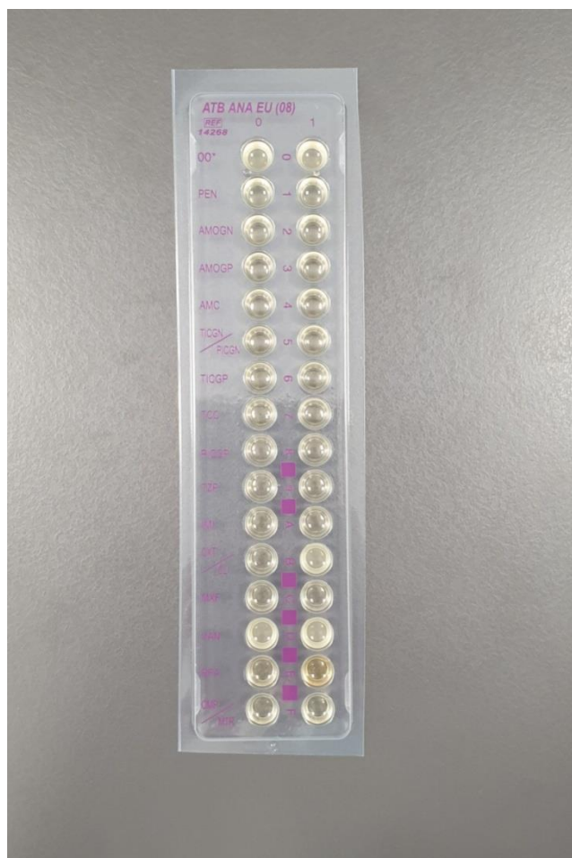
Slika 1. Komercijalno dostupan sustav (ATB ANA, Biomerieux, France) za ispitivanje osjetljivosti metodom prijelomne točke

Ispitivanje osjetljivosti anaerobnih bakterija provodi se i metodom prijelomne točke ( breakpoint ). Ova je metoda modificirani oblik dilucijske metode u bujonu. U jažicu se prenosi suspenzija koja je prethodno načinjena od određene koncentracije antibiotika i bakterije koju želimo testirati (Slika 1). Koncentracija antibiotika predstavlja „prijelomnu točku“ za određivanje je li bakterija osjetljiva ili otporna. Ukoliko je bakterija osjetljiva na antibiotik u jažici neće doći do zamućenja, odnosno porasta bakterije. Ukoliko je MIK (minimalna inhibitorna koncentracija) manji ili jednak osjetljivosti prijelomne točke, bakterija se smatra osjetljivom na antibiotik. Metoda se primjenjuje u rutinskom radu u laboratoriju.