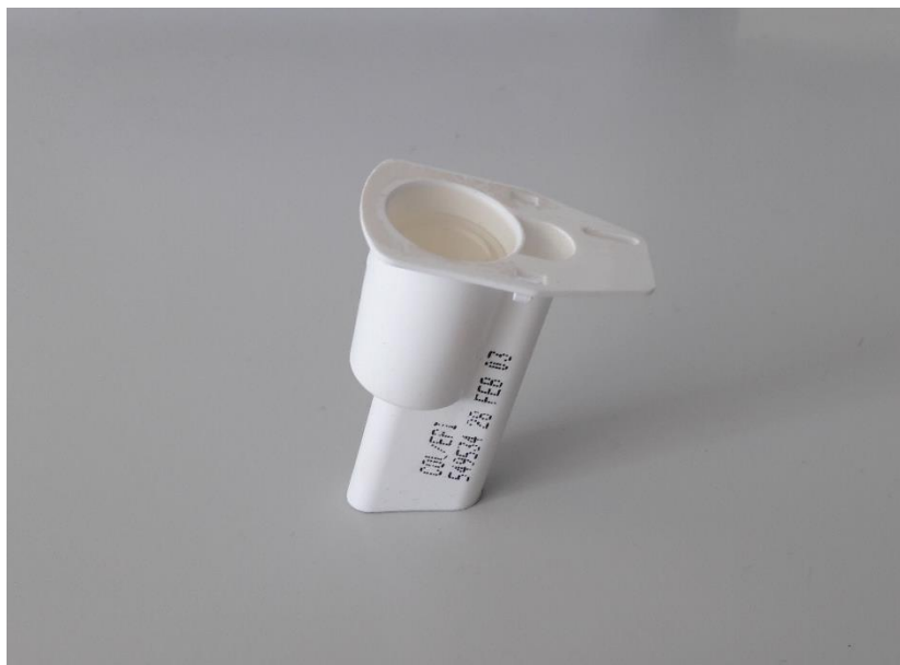
Slika 2. Testna kazeta Col/Epi.

Formiranje tromba u PFA sustavu je pod utjecajem sniženog broja trombocita, njihove smanjene aktivnosti, snižene razine vWF u plazmi ili smanjenog hematokrita (11).