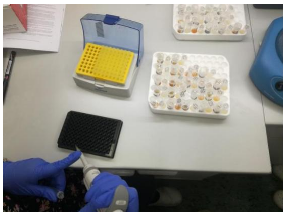
Slika 1. Prikaz dodavanja detekcijskog protutijela pipetom na Luminex pločicu

Eksperimentalni postupci bili su u skladu s Europskim smjernicama za njegu i uporabu laboratorijskih životinja (Direktiva 86/609) te su odobreni od Lokalnog etičkog povjerenstva (# 2158-61-07-18-138) 28. rujna 2018., Nacionalnog etičkog odbora (EP 195/2019) i Ministarstva poljoprivrede (# 525-10 / 0255-19-7) 12. travnja 2019. godine.