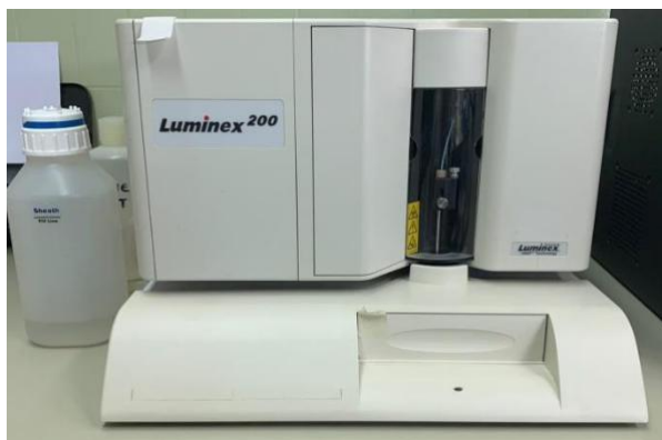
Slika 2. Luminex 200 uređaj, (fotografirala autorica rada)