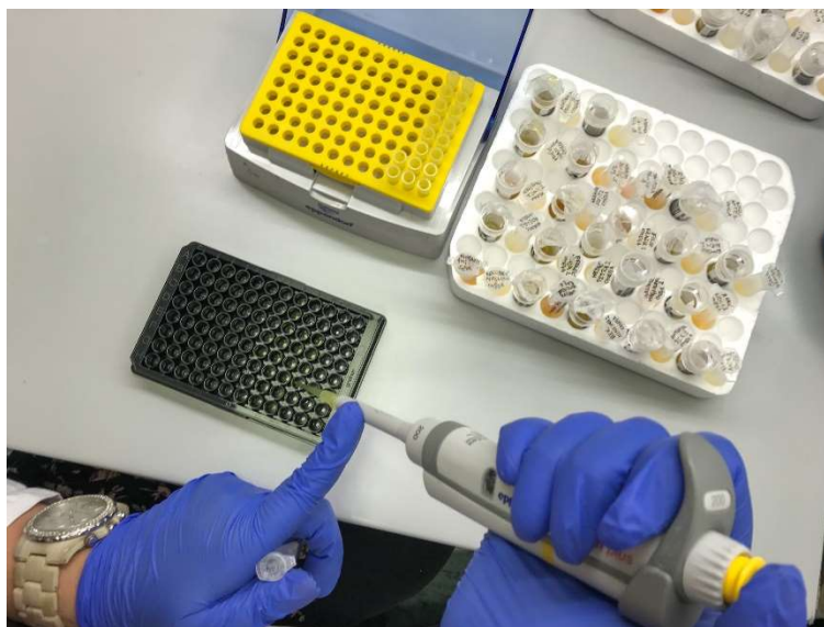
Slika 4. Pipetiranje uzoraka seruma na crnu ploču s 96 jažica