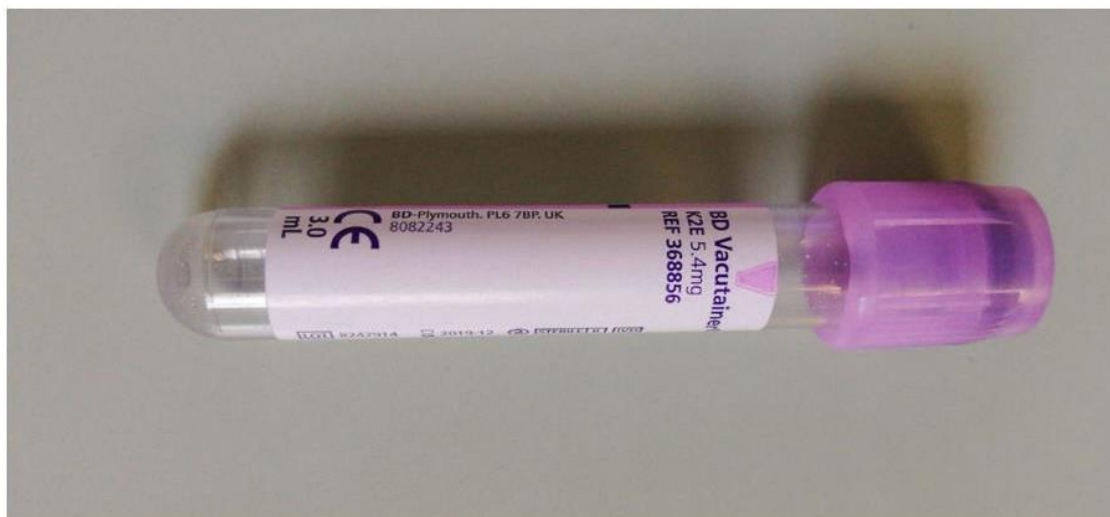
Slika 2. Epruveta za imunohematološke pretrage

Materijali koji se koriste za IAT, odnosno analizatore Tango Optimo (slika 3) i Tango Infinity (Slika 4) jesu: