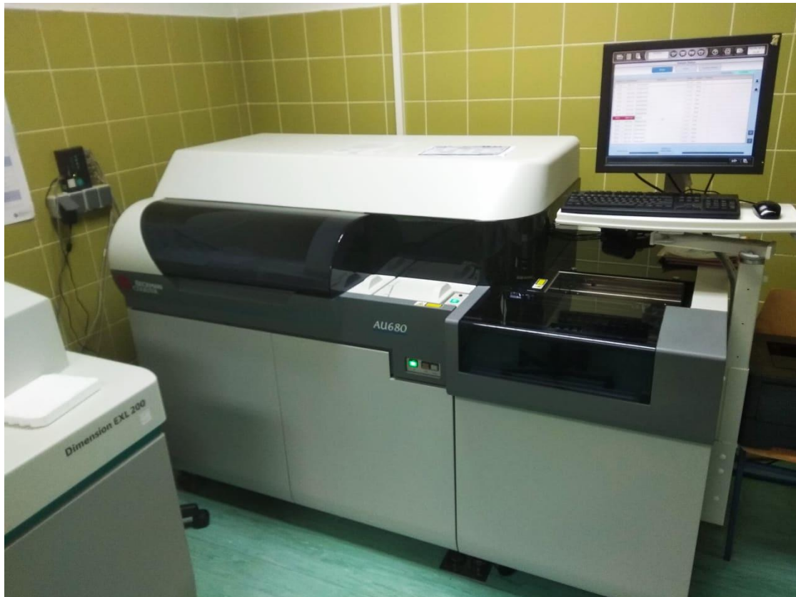
Slika 3. Beckman Coulter AU680 uređaj

Princip metode određivanja HbA1c u krvi: HbA1c određuje se u punoj krvi koja je prikupljena u epruvetu s ljubičastim čepom u kojoj se nalazi antikoagulans etilendiamintetraoctena kiselina (EDTA). HbA1c određen je imunoturbidimetrijskom metodom na instrumentu Dimension ExL (Slika 4.), tvrtke Siemens, također koristeći njihov reagens. Dimension uređaj mjeri i HbA1c i ukupni hemoglobin. Kod mjerenja ukupnog hemoglobina, uzorak pune krvi dodaje se u kivetu u kojoj se nalazi lizirajući reagens. Taj reagens lizira eritrocite i tako omogućuje izlazak hemoglobina iz eritrocita. Zatim se alikvot lizirane krvi prebacuje u drugu kivetu u kojoj se mjeri koncentracija ukupnog hemoglobina spektrofotometrijski na 405 i 700 nm. Za mjerenje HbA1c koristi se isti alikvot lizirane pune krvi kao i kod mjerenja ukupnog hemoglobina. U drugoj kiveti nalazi se anti-HbA1c antitijelo s kojim HbA1c stvara topljivi antigen-antitijelo kompleks. Zatim se u kivetu dodaje polihapten reagens s epitopima za HbA1c. Polihapten reagira sa suviškom anti-HbA1c antitijelima i stvara netopive komplekse koji se mjere turbidimetrijski na valnoj duljini 340 nm. Koncentracija HbA1c izražava se kao omjer HbA1c i koncentracije ukupnoga hemoglobina.