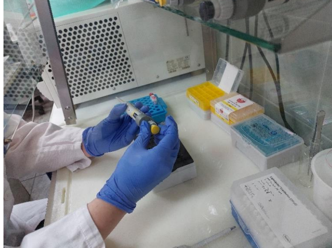
Slika 2. Priprema reakcijske smjese (fotografiju snimila N. Kenjerić u Laboratoriju za molekularnu i HLA dijagnostiku, KBC Osijek, travanj 2022.)

Genotipizacija HFE izvođena je pomoću uređaja LightCycler® 1.2 Real time PCR System (Roche Diagnostics Ltd., Švicarska) (Slika 3.).