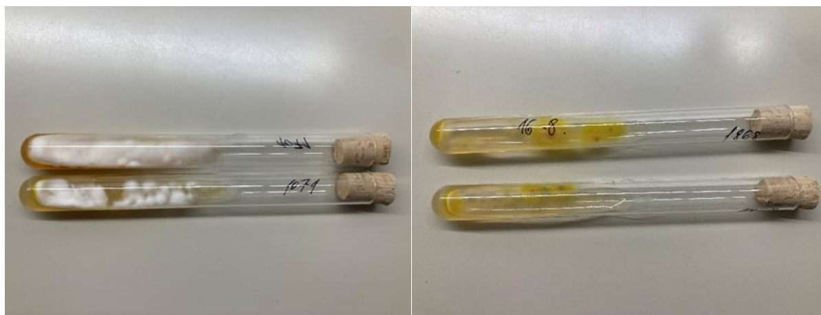
Slika 2. i 3. Kolonije M.canis , Sabouraud agar

M.canis spada u brzorastuće dermatofite pa se često porast vidi nakon 5 - 7 dana. Porasle kolonije imaju bjelkastu, pahuljastu površinu, s radijalnim brazdama i žutim pigmentom na periferiji, reverzna strana kolonija je tamno žute boje koja starenjem postaje smečkasta. Na DTM-u, ukoliko je M.canis prisutan, dolazi do promjene boje iz žute u crvenu jer produkti metabolizma ovog dermatofita alkaliziraju medij (36).