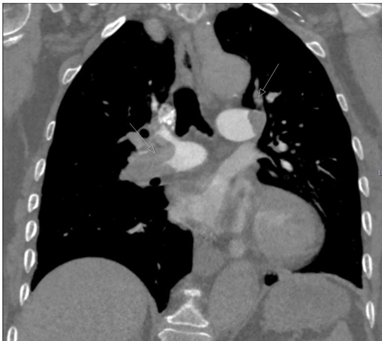
Slika 1. Koronarna rekonstrukcija CT angiografije plućnih arterija s prikazom trombotskog sadržaja obostrano unutar glavnih plućnih arterija i segmentalnih ogranaka-označeno strelicama