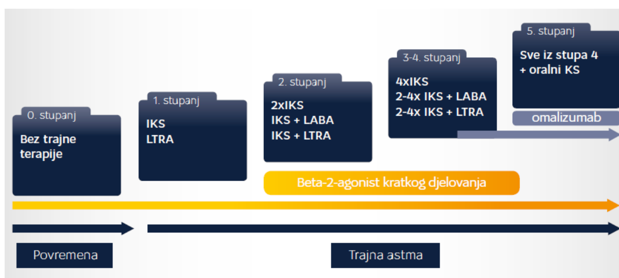
Slika 1. Stupnjeviti pristup liječenju astme

specifičnim indikacijama preporučiti liječenje omalizumabom (anti-IgE-monoklonsko protutijelo). U svakom stupnju težine bolesti kao prva terapijska opcija za liječenje astme preporučuje se beta-2-agonist kratkog djelovanja (salbutamol). Ostale mjere liječenja poput kontrole okoliša, provođenje edukacije, te provjeru adherencije potrebno je provoditi u svim stupnjevima, osobito kada se terapija povisuje na viši stupanj. Kod bolesnika s lošom kontrolom astme potrebno je provjeriti postoje li pridružene bolesti kao što su alergijski rinitis ili gastroezofagealni refluks. Nakon određenog perioda liječenja u slučaju dobre kontrole astme može se preporučiti terapija nižeg stupnja, kako bi se smanjilo opterećenje lijekovima, a tako i rizik od nuspojava.