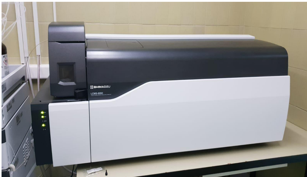
Slika 3. Uređaj LCMS-8050, Shimadzu.