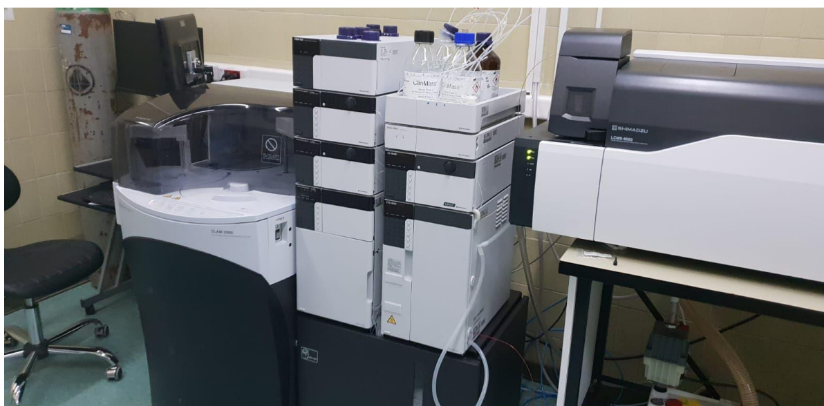
Slika 4. Prikaz uređaja NEXERA X2 HPLC koji je povezan sa LCMS-8050.