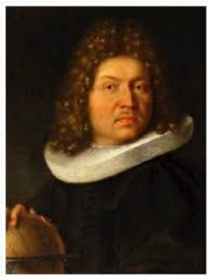
Jacob Bernoulli (1655. - 1705.)

Samo rješavanje diferencijalnih jednačbi zauzima pažnju znanstvenika od početka razvoja diferencijalnog računa do danas. Diferencijalne jednačbe prvog reda uspješno je rješavao švicarski matematičar Jacob Bernoulli (1655.-1705.). Jednu važnu i vrlo općenitu metodu za rješavanje diferencijalnih jednačbi uveo je francuski matematičar Joseph Lagrange (1736.-1813.).