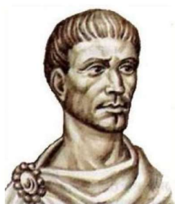
Slika 1: Diofant

Diofant, koji se smatra "ocem matematike", bio je grčki matematičar o čijem životu vrlo malo znamo. Ne mogu se točno odrediti godine njegovog djelovanja, no pretpostavlja se da je djelovao negdje između 350. i 150. g. pr. Kr., točnije većina povjesničara smatra da je Diofant živio oko 250. g. pr. Kr. što pripada Srebrnom dobu matematike. Ono što se zasigurno zna jest da je Diofant živio u Aleksandriji koja je u ono vrijeme bila središte proučavanja matematike. Najpoznatije njegovo djelo je "Aritmetika" (Slika 2), za koje se vjeruje da je originalno imalo 13 knjiga, no do danas je sačuvano samo 6. Djelo je vrlo značajno za sve grane matematike pa tako i za teoriju brojeva. Sastoji se od 150 problema koji daju aproksimacije rješenja jednadžbama do trećeg stupnja. Diofant je