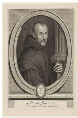
Slika 1.1. Marin Mersenne

Studije je završio 1611. godine i odlučio se za život u samostanu. Nakon što se zaređio za svećenika, od 1614. do 1618. predavao je filozofiju i teologiju u samostanu u Neversu. Osim za filozofiju i teologiju, posebno je bio zainteresiran za matematiku te je smatrao da je znanost nemoguća bez matematike. Proučavao je proste brojeve, permutacije, barometre i zakon gravitacije. Mersenne je bio sposoban razumijeti i cijeliti rad drugih. Dolaskom u Pariz 1619. uvidio je nedostatak bilo kakve formalne organizacije u kojoj bi znanstvenici mogli djelovati. Svoj samostan učinio je mjestom redovitih susreta za sve one koju su htjeli razgovarati o svojim radovima i rezultatima, te slušati o tuđim idejama i radovima. Okupljao je znanstvenike iz različitih zemalja te je bio posrednik znanstvenih informacija. Kroz mrežu dopisivanja, kojom su se prenosile vijesti o napretku znanosti i novim otkrićima, potrudio se stupiti u kontakt sa svim ljudima koji su bili od neke važnosti u svijetu znanosti. Kroz brojna pitanja koja je postavljao u svojim pismima, Mersenne je poticao sve znanstvenike, koji bi mogli pridonijeti pronalaženju nekog odgovora, na razmišljanje. Njihove odgovore i pitanja prenosio je dalje drugima kako bi izazvao njihove reakcije. Nakon njegove smrti, pronađena su pisma od 78 različitih dopisnika među kojima su Fermat, Huygens, Hobbes, Pell, te Galileo i Torricelli.