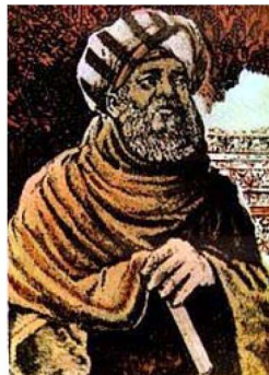
Slika 3.1. Thabit ibn Qurra (836. - 901.)

Prvo eksplicitno pravilo za pronalaženje određenih prijateljskih brojeva priznaje se arapskom matematičaru devetog stoljeća, Thabit ibn Qurrau. Osim što se bavio matematikom, Thabit ibn Qurrau bio je fizičar, astronom i prevoditelj. Pravilo za pronalazak prijateljskih brojeva njegov je najveći doprinos u matematici.