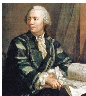
Slika 2.2. Leonhard Euler (1707. - 1783.)

Švicarski matematičar, fizičar i astronom Leonhard Euler, 1732. godine je proširio Fermatovo istraživanje i tvrdio da ako su n = 4k - 1 i 8k - 1 prosti, tada je 8k - 1 faktor od 2^n - 1 . Taj rezultat iskoristio je kako bi dokazao da je 2^n - 1 složen za n = 11, 23, 83, 131, 179, 191 i 239 , te kako bi pronašao djelitelje od 2^n - 1 za n = 29, 37, 43, 47 i 73 . Formalni dokaz ovih tvrdnji dao je Lagrange 1775. godine.