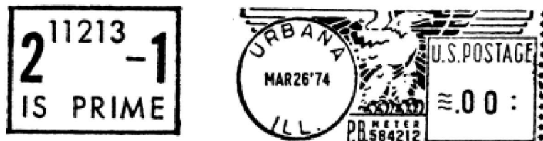
Slika 1.2. Poštanska marka

Razvojem modernih računala pronalazak većih Mersenneovih brojeva postao je lakši i uspješniji. 1952. godine otkriveno je pet novih Mersenneovih brojeva: M_{521} , M_{607} , M_{1279} , M_{2203} i M_{2281} . 1957. i 1961. godine otkriveni su M_{3217} , M_{4253} i M_{4423} . U sklopu Sveučilišta Illionis u Urbana - Champaignu 1963. godine pronađena su tri nova Mersenneova broja. Zanimljivo je da su se nakon otkrića ti brojevi u obliku žiga pojavljivali na poštanskoj markici grada Urbana. ( Slika 1.2. Poštanska marka )