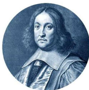
Slika 2.1. Pierre de Fermat (1601. - 1665.)