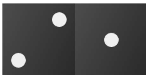
Slika 1: Domino 2/1