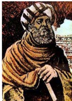
Slika 3.1. Thabit ibn Qurra (836. - 901.)

Prvo eksplicitno pravilo za pronalaženje određenih prijateljskih brojeva priznaje se arapskom matematičaru devetog stoljeća, Thabit ibn Qurrau. Osim što se bavio matematikom, Thabit ibn Qurrau bio je fizičar, astronom i prevoditelj. Pravilo za pronalazak prijateljskih brojeva njegov je najveći doprinos u matematici.