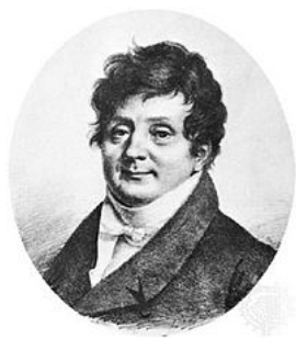
Slika 1: Jean Baptiste Joseph Fourier

U ovom radu bavit ćemo se dijelom Fourierove analize poznat pod nazivom Fourierov red. Fourierova analiza je moćan alat za rješavanje mnogih problema kao što su parcijalne diferencijalne jednačbe u području znanosti i inženjerstva. Fourierova analiza proizašla je iz ideje da svaku periodičku funkciju možemo zapisati kao sumu kosinusnih i sinusnih funkcija različitih amplituda, faza i frekvencija. Takva suma naziva se Fourierov red. Matematičar Jean Baptiste Joseph Fourier (1768.-1830.), slika 1, došao je na tu ideju tako što je postavio problem rješavanja parcijalne diferencijalne jednačbe provođenja topline. Sve svoje teorije o danom problemu i Fourierovim redovima objavio je u svom radu "Analitička teorija topline" 1822. godine. Danas su Fourierove teorije dalje razvijene, poput Fourierove transformacije koju ćemo spomenuti kasnije. Tome su pridonijeli kasnije i Dirichlet i Riemann.