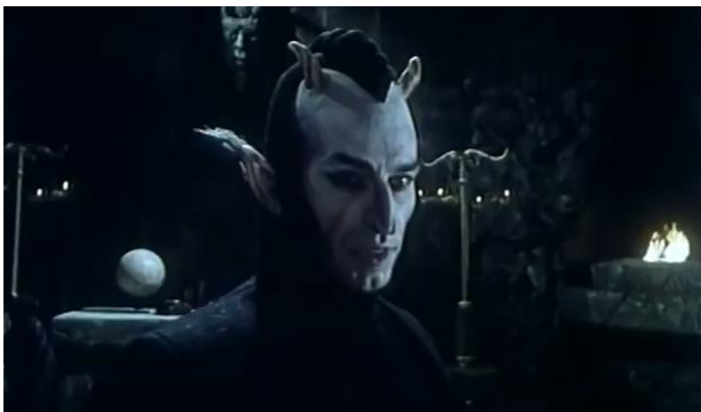
Slika 6: Prikaz sotone u filmu 'Čovjek koga treba ubiti' (1979.) red. Veljko Bulajić

Tijekom 1979. godine pojavio se film crnogorsko-hrvatske produkcije u režiji Veljka Bulajića pod nazivom Čovjek koga treba ubiti . Povijesno-fantastični film koji izlazi iz gabarita dotadašnje jugoslavenske kinematografije, Čovjek koga treba ubiti opisuje legendu o samoprozvanom crnogorskom caru Šćepanu Malom neznanog porijekla, koji je vladao Crnom Gorom u drugoj polovici osamnaestog stoljeća, preciznije od 1767. do 1773. godine, predstavljajući se kao ruski car Petar III. Ukratko, nakon ubojstva pravog ruskog cara Petra III. po naredbi carice Katarine II., Sotona zaključuje kako iz svojih redova u paklu treba poslati svog izaslanika na Zemlju, kako bi se ponovno uspostavila ravnoteža između predstavnika pakla i raja na Zemlji. U liku Šćepana Malog, Sotona šalje paklenog učitelja Farfu, koji uvelike izgleda kao Petar III., da zavlada Crnom Gorom i povede narod protiv Turaka. Gledajući crnogorski narod kako teško živi i kako mu sve više postaje odan i vjeran, Šćepan Mali sve više odmiče od Sotone i njegovog plana te se priklanja smrtnicima, pritom se i zaljubivši, što Sotonu čini gnjevnim i odlučnim ukloniti svog nekadašnjeg izaslanika.