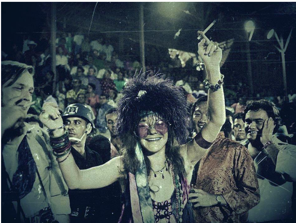
Slika br. 8 „Janis Joplin, 1970.“

Janis je umrla 4. listopada 1970. godine u Los Angelesu, u dvadeset i sedmoj godini života. Od tada je prošlo četrdeset i osam godina, ali interes za njezin život i doba u kojem je živjela ne jenjava. Zbog njezinog bunta i odbacivanja svih okova konvencionalnosti uvijek će ostati prepoznata kao istinska legenda blues rocka.