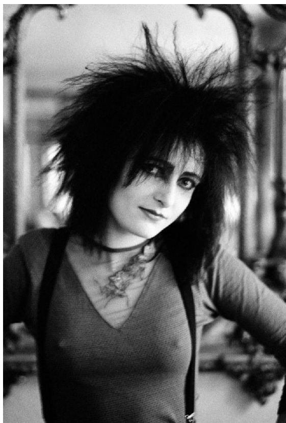
Slika br. 11 „Siouxsie Sioux”

„Radi se o ženskim punk bendovima poput The Slits ili bendovima s frontmenicama poput Siouxsie Sioux, u kojima žene nisu pokazivale ranjivost i nisu igrale uloge zavodnica i fatalnih žena, a unatoč tome, moć su izražavale svojom seksualnošću, ali i inteligencijom i bijesom.” 48