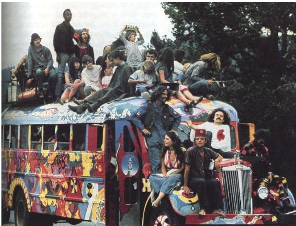
Slika br. 6 „Pripadnici hippie pokreta“

„Glazba je također postala strast za Janis i njene buntovne prijatelje. Glazba nije bila samo buka u pozadini; bila je objava različitosti. Slušajući kasno noćne radijske emisije ili kopajući po policama lokalne prodavaonice ploča, istraživali su glazbu kakvu nikad prije nisu čuli – posebno folk, jazz i blues. Za njih je to bila buntovnička glazba, neiskvarena komercijalizacijom.“ 37