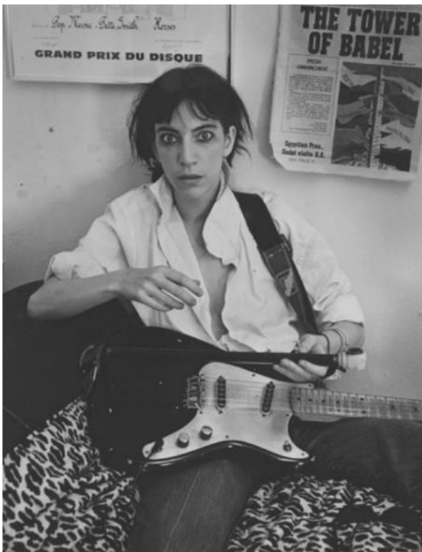
Slika br. 11 „Patti Smith“

“Prvih godina u New Yorku mladi se par družio s beatnicima i prisustvovao mnogim čitanjima poezije za koja je Patti izjavila kako su često bila naprosto dosadna, te je ona, i sama pjesnikinja, odlučila kako će njezino prvo javno čitanje biti nešto posve drugačije. Tako je i bilo.” 50