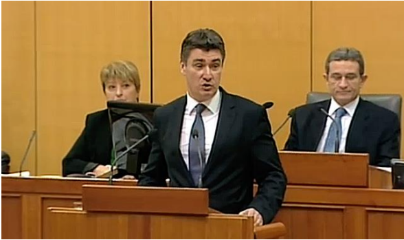
Slika – Zoran Milanović u Saboru, 2011.

mikrofoni stalno okružuju i prate, svjestan sam, jako olakšava i banalizira novinarski posao. Ne želim tome stajati na putu, ali nemam želje, niti mi je zadaća da u tome sudjelujem“.( vlada.gov.hr ) Javno mnijenje zapravo želi iskrenost i ljudskost, kada bi naši političari shvatili kojom retorikom trebaju komunicirati sa svojim narodom, komunikacija bi bila kompletna. Javnost danas želi istinu, onakvu kakva je, želi čuti mišljenje, želi konkretne činjenice i rješenja na probleme koji obuhvaćaju Hrvatsku već jako dugo.