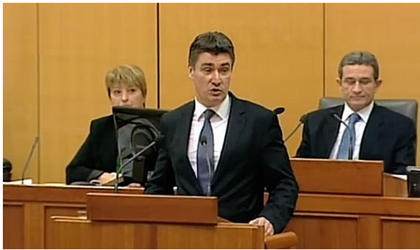
Slika – Zoran Milanović u Saboru, 2011.

mikrofoni stalno okružuju i prate, svjestan sam, jako olakšava i banalizira novinarski posao. Ne želim tome stajati na putu, ali nemam želje, niti mi je zadaća da u tome sudjelujem“.( vlada.gov.hr ) Javno mnijenje zapravo želi iskrenost i ljudskost, kada bi naši političari shvatili kojom retorikom trebaju komunicirati sa svojim narodom, komunikacija bi bila kompletna. Javnost danas želi istinu, onakvu kakva je, želi čuti mišljenje, želi konkretne činjenice i rješenja na probleme koji obuhvaćaju Hrvatsku već jako dugo.