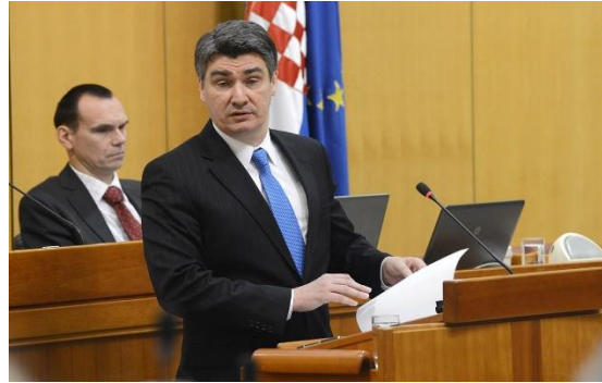
Slika- Zoran Milanović,2015.

Usprkos pažljivom komuniciranju, kontroverzne izjave iz 2012.godine i to u prvih sto dana nove vlade Zorana Milanovića, dovodi do nejasnih informacija u javnosti. Primjer koji daje profesor Lalić prilično je razgllašena izjava od 13. rujna 2012. u kojoj je Hrvatske laburiste nazvao populistima zbog toga što su kreditni rejting Hrvatske nazvali "zavjerom londonskih bankara". Odgovor je Zoran Milanović primio ubrzo od Dragutina Lesara : "Kada me politički elitisti i snobovi optužuju za populizam, onda je to za mene kompliment". Milanović je htio pokazati da želi voditi nepopulističku politiku i naravno u skladu s time je trebao i oblikovati retoriku. ( youtube.com ) (Dražen Lalić, 2013)