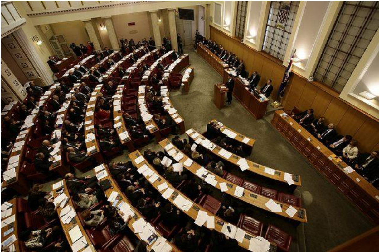
Slika – Hrvatski Sabor i političari