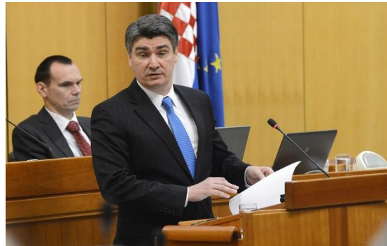
Slika- Zoran Milanović,2015.

Usprkos pažljivom komuniciranju, kontroverzne izjave iz 2012.godine i to u prvih sto dana nove vlade Zorana Milanovića, dovodi do nejasnih informacija u javnosti. Primjer koji daje profesor Lalić prilično je razgllašena izjava od 13. rujna 2012. u kojoj je Hrvatske laburiste nazvao populistima zbog toga što su kreditni rejting Hrvatske nazvali "zavjerom londonskih bankara". Odgovor je Zoran Milanović primio ubrzo od Dragutina Lesara : "Kada me politički elitisti i snobovi optužuju za populizam, onda je to za mene kompliment". Milanović je htio pokazati da želi voditi nepopulističku politiku i naravno u skladu s time je trebao i oblikovati retoriku. ( youtube.com ) (Dražen Lalić, 2013)