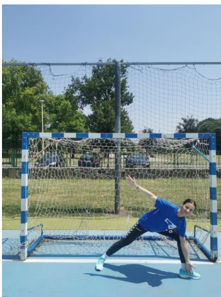
Slika 4. Obrana niskog udarca

Iz osnovnog stava vrši se otklon suprotnom nogom u odnosu na loptu, koji je usmjeren pod što manjim uglom. Noga bliža lopti istovremeno vrši bočni iskorak tako da se težina u potpunosti prenosi na iskoračnu nogu. Trup se otklanja prema mjestu kontakta s loptom uz istovremeno okretanje oko uzdužne osovine prema naprijed. Bliža ruka se ispruža i postavlja ispred iskoračne noge gotovo do tla, dok je slobodna ruka ispružena i nalazi se s druge strane trupa radi održavanja ravnoteže (Slika 4.) (Rogulj, 2000).