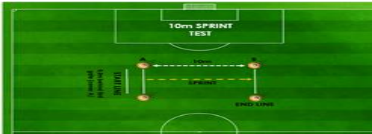
Slika 3. Test sprint na 10 metara

T-test je test agilnosti. Izvodi se na ravnoj i tvrdoj podlozi u dvorani. Na udaljenosti od 10 yarda (9,14m) od startne linije postavljen je čun, te su na udaljenosti od 5 yarda (4,57m) od tog čunja lijevo i desno postavljeni čunjevi. Ispitanik zauzima poziciju visokog starta i na znak mjeritelja počinje trčati. Kada dođe do čunja obavezno ga mora dotaknuti, a zatim ide lijevo bočnim kretanjem (dokorakom) do drugog čunja kojeg mora dotaknuti. Nakon toga ide desno bočnim kretanjem (dokorakom) do trećeg čunja kojeg također mora dotaknuti. Vraća se do prvog čunja bočnim kretanjem u lijevo i trči unatrag do startne linije. Zadatak se tri puta s pauzom, a kao meritorni rezultat se uzima najbolji rezultat. Svrha mjerenja je procjena čeone agilnosti i bočne agilnosti (Slika 4).