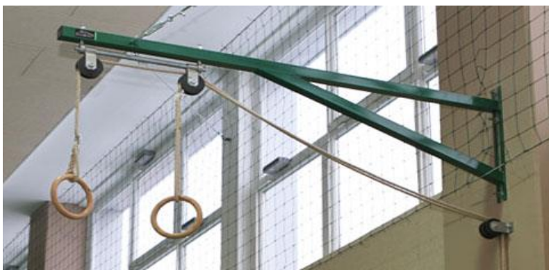
Slika 6. Krugovi