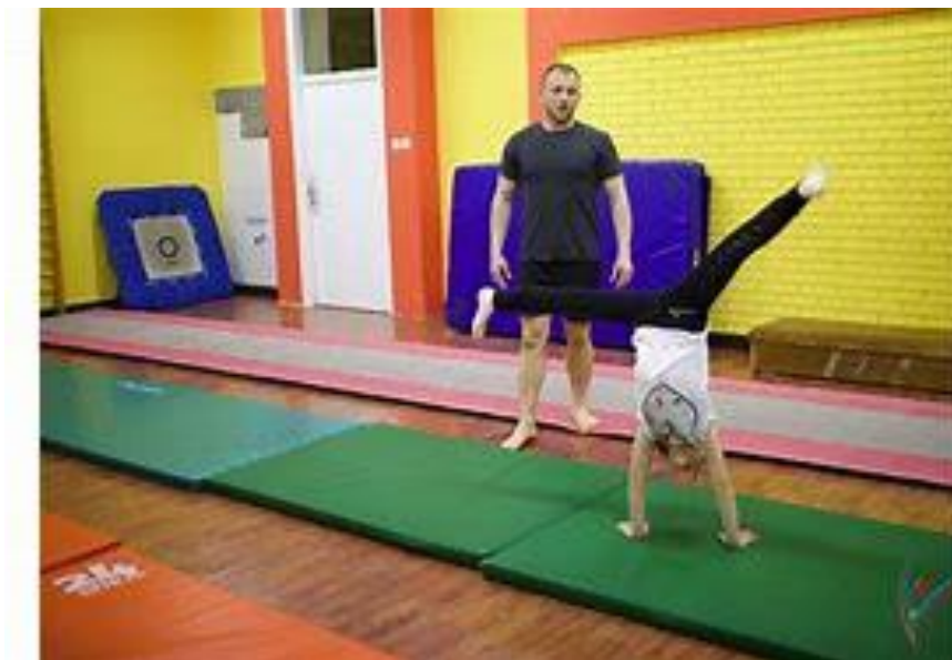
Slika 3. Strunjače za rad na nastavi TZK