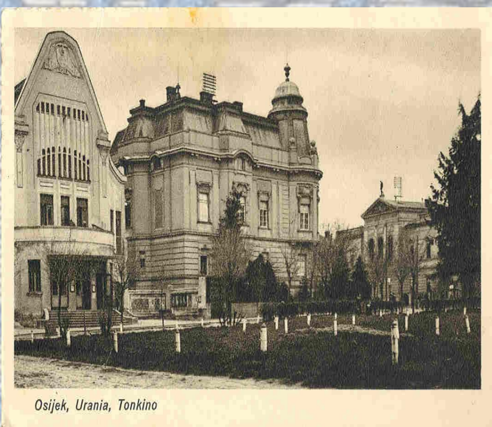
Osijek, Urania, Tonkino

Digitalizacija razglednica starog Osijeka započela je 2011. godine.