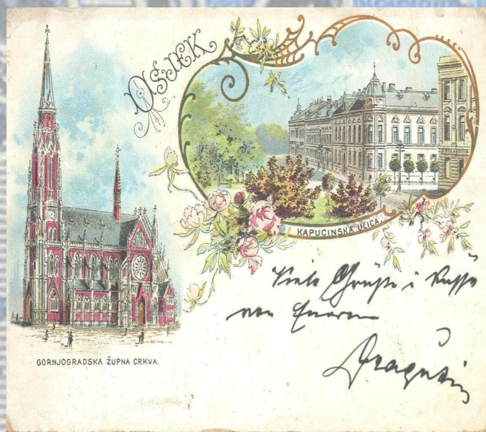
OSJEK GORNJODRAČKA ŽUPNA CRKVA.