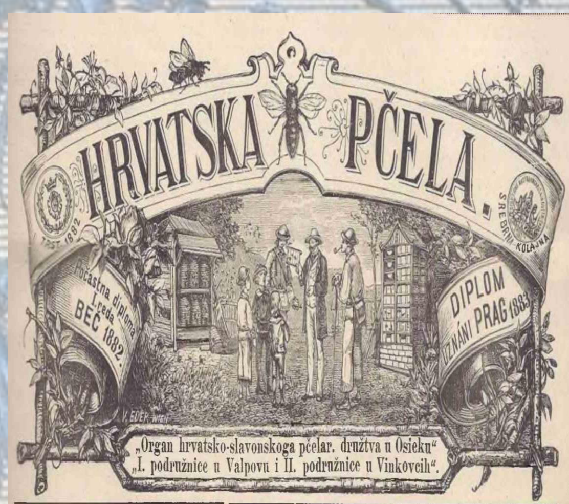
Ovom je družtu pokroviteljem Pravitelj gospodin dr. TEDOR graf PEJAGEVIĆ, veliki župan županije vinkovitičke.

Gradska i sveučilišna knjižnica Osijek posjeduje bogatu zavičajnu zbirku temeljenu na fondu Knjižnice Gradskog narodnog odbora Gornji grad (1947.) te fond Knjižnice Gradskog narodnog odbora Donji grad (1948.). Nužna je obrada, organizacija, zaštita i prezentacija tih zbirki.