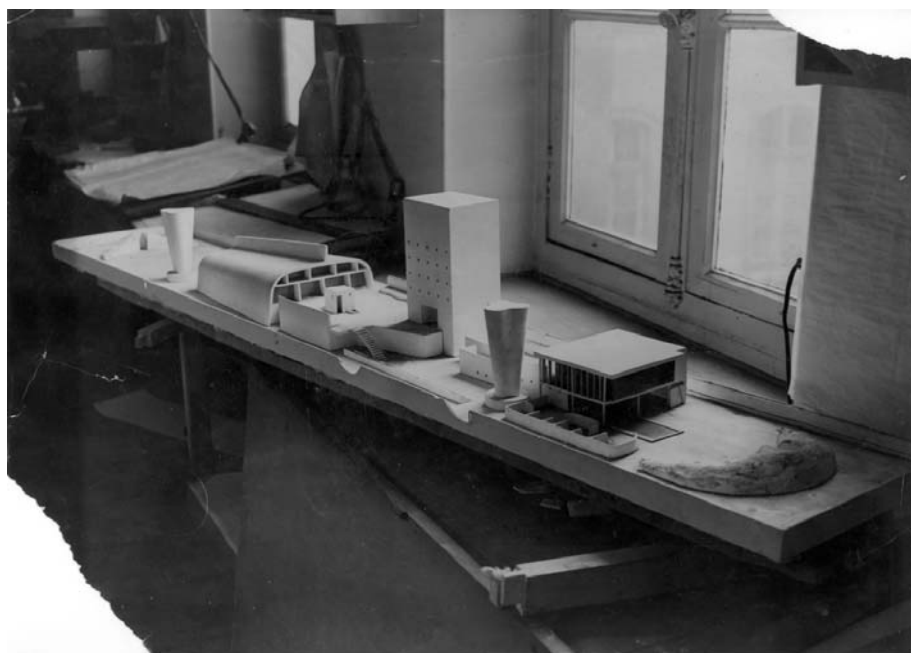
Slika 5 – Le Corbusier: maketa krovne terase marseilleskog Unitéa, početkom 1950-ih [6]

Na najvišem, sedamnaestom katu, smješteno je odmaralište za stanare – velika zajednička krovna terasa (slika 5). Jedna rampa vodi direktno na krovnu terasu gdje se nalazi, postavljena na tankim stupovima, prostorija za odmor, plitki bazen i nekoliko dječjih igrališta. Druga strana krovne terase, velike 24 x 165 metara, određena je za rekreaciju odraslih. Ovdje se nalazi dvorana za sportske aktivnosti i sportski teren, dok na sjevernom kraju velika betonska ploča služi kao zaštita od jakog sjevernog vjetrova, maestrala, a istovremeno služi kao pozadina za krovnu pozornicu.