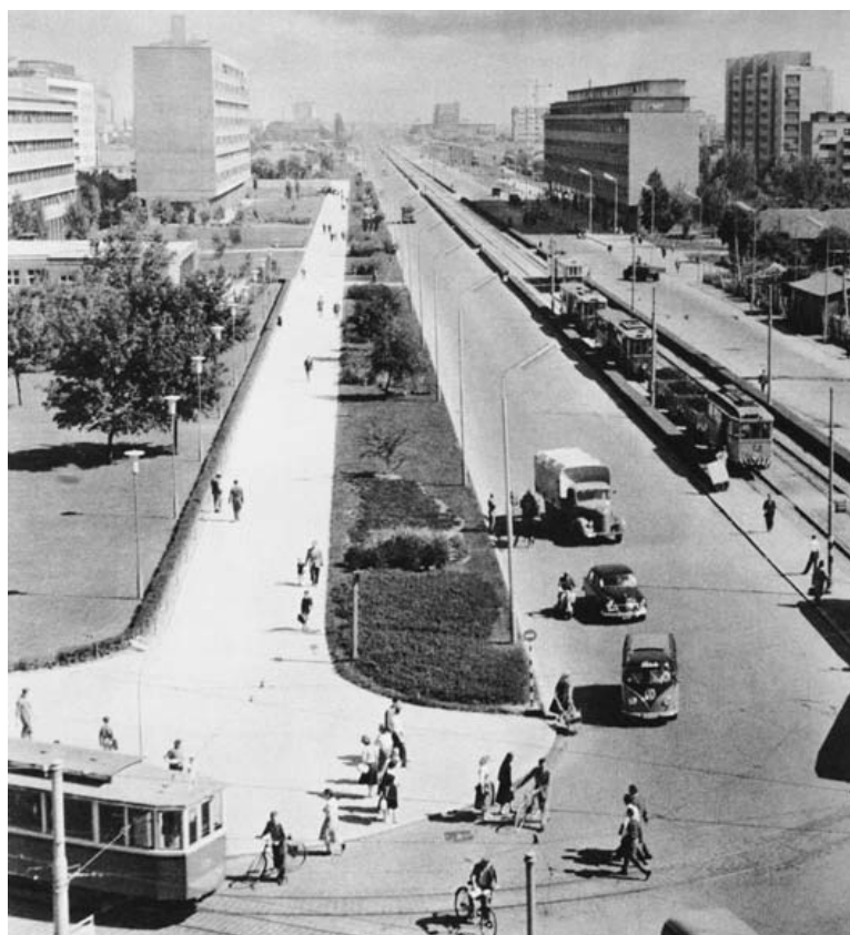
Slika 1 – Ulica grada Vukovara u Zagrebu sredinom 1950-ih (tada Beogradska i Ulica proleterskih brigada). Zgrada lijevo višestambena zgrada Drage Galića na broju 35, 35a.

Stambena zgrada u Ulici grada Vukovara 35/35a – velikom bulevaru koji se gradio u socijalističkoj epohi zagrebačkog urbanizma [4], Galićeva je zgrada koja je odmah po izgradnji izazvala stanovitu pomutnju među arhitektima i kritičarima arhitekture, i to vjerojatno više nego ijedna druga (slika 1). Iako joj nitko ne odriče kvalitetu, većina je dovodi u vezu s marseilleskim Unitéom Le Corbusiera. Poznavatelju Galićeva opusa ovog projekta bit će jasno da se ipak radi o drugačijem pristupu rješavanja osnovnih stambenih jedinica, ali su istovremeno upotrijebljeni elementi moderne arhitekture koji dovode do brojnih sličnosti, tek na prvi pogled samo oblikovnih i sličnosti pročelja. Prije svega, tu se radi o određenom problemu koncepta, jer je zgrada u Zagrebu koncepcijski potpuno jednaka Le Corbusierovu originalnom djelu.