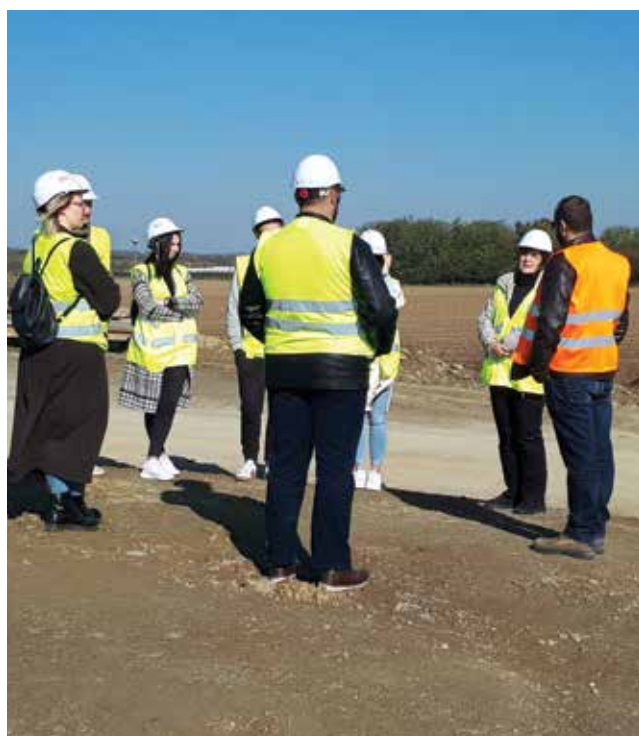
Gradilište dionice autoceste A5 Beli Manastir – Osijek – Svilaj, poddionica Most Halasica – Beli Manastir, listopad 2021.

ca koji su sudjelovali u projektu prešao broj od 1200 sudionika. Najvažniji segment toga impresivnog broja čini ipak 250 studenata i 106 poslodavaca koji su zajedno provodili stručnu praksu. Najveći broj stručnih praksi realiziran je na području Osječko-baranjske županije (59 %), Grada Zagreba i Zagrebačke županije (15 %) te Vukovarsko-srijemske županije (14 %). Prema izvješćima mentora, poslovi koje su studenti obavljali tijekom stručne prakse (projektant suradnik, pomoćnik inženjera gradilišta, pomoćnik nadzornoga inženjera, suradnik voditelja projekta, rad u ispitnome laboratoriju) pokrivaju i opće i specifične ishode učenja stručne prakse, što upućuje na zaključak da su poduzeća u kojima su studenti obavljali praksu primjerena za postizanje ishoda učenja te da su mentori dobro pripremljeni i motivirani. Njihova su zajednička iskustva, prikupljena iz anketa, zapisa u dnevnicima stručne prakse, evaluacijskih obrazaca i razgovora, toliko pozitivna i motivirajuća da su i prije završetka projekta potaknula intenzivno umrežavanje Fakulteta i tržišta rada.