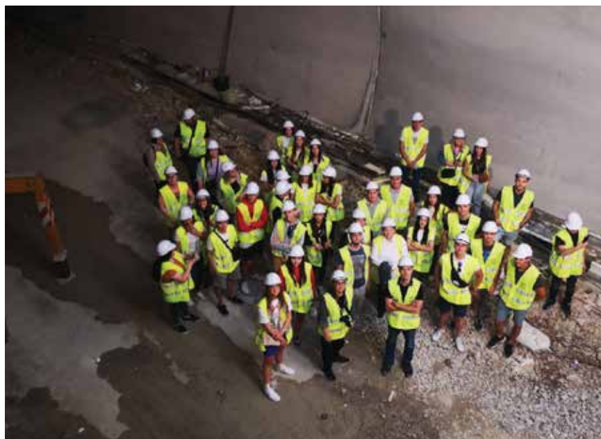
Gradilište tunela Podmurvice na državnoj cesti DC403, lipanj 2022.

stekli tijekom stručne prakse te pozitivnih komentara mentora nameće se zaključak da je takav model stručne prakse održiv, koristan i primjenjiv. Rezultati provedenoga istraživanja sugeriraju da bi u budućnosti bilo korisno unaprijediti