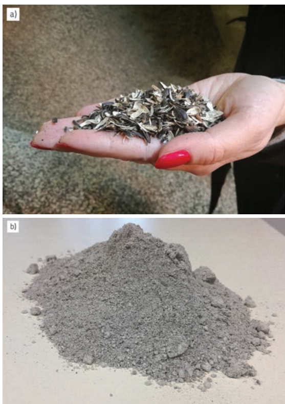
Slika 3. a) Suncokretove ljuske; b) Biopepeo od spaljivanja suncokretovih ljusaka

Udio biomase kao obnovljivog izvora u proizvodnji ukupne energije sve je veći. Spaljivanjem biomase u termoelektranama nastaju velike količine pepela koji treba ponovno upotrijebiti. Nastali pepeo najčešće se odlaže na odlagalištima otpada, a s obzirom na trend povećanja udjela obnovljivih izvora u cjelokupnoj proizvodnji energije, količine nastalog pepela sve se više gomilaju. Povoljna fizikalna i kemijska svojstva biopepela, kao i pozitivna iskustva primjene pepela od izgranja ugljena, potaknula su i sve brojnija istraživanja primjene biopepela u građevinarstvu. Provedena su istraživanja pokazala da biopepeli znatno variraju u svom sastavu i svojstvima ovisno o porijeklu biomase, rukovanju biomasom, načinu i temperaturi spaljivanja. Velik raspon svojstava znači i brojne mogućnosti primjene biopepela u cestogradnji kao zamjene tradicionalnim materijalima. Kemijski sastav biopepela, osobito udio \text{CaO} i pucolana, upućuje na mogućnost djelomične ili potpune zamjene